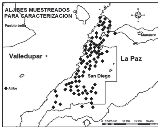
Figura 1. Ubicación geográfica de los aljibes.

Cesar-Colombia. (Figura 1). En estos municipios existen alrededor de 300 aljibes de los cuales se trabajó con una población de 93, distribuidos espacialmente de forma estratégica con el fin de tomar muestras representativas que permitieran hacer una ponderación y, al mismo tiempo, conocer las características de la totalidad de los aljibes ubicados en el área descrita, los cuales fueron ubicados por medio del sistema de posicionamiento global.