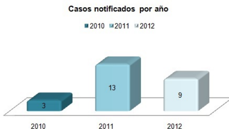
Figura 1 Número de casos notificados por mortalidad materna periodo 2010- 2012.

En la presente investigación se analizaron el 100% de los de casos notificados para mortalidad materna en el periodo objeto de análisis, presentándose en total 25 casos, 3 casos notificados en el año 2010, 13 casos notificados en el año 2011 y 9 casos reportados en el año 2012, tal como se presenta en la Figura 1 .