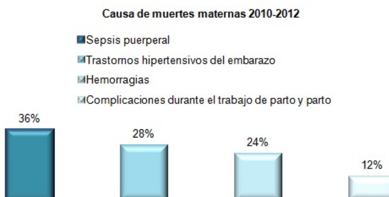
Figura 2 Causa de muertes maternas (casos notificados) periodo 2010- 2012.

En relación a la causa de las muertes se encontró relacionados los siguientes diagnósticos de acuerdo a la clasificación CIE 10 ( Figura 2 ).