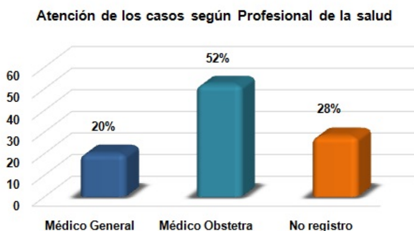
Figura 3 Fichas de notificación obligatoria de mortalidad materna distrito de Barranquilla departamento del Atlántico.

Asimismo se identificó que el 56% de las maternas fueron atendidas en proceso parto por cesárea, 16% en parto por vía vaginal y 28% no se registró información.