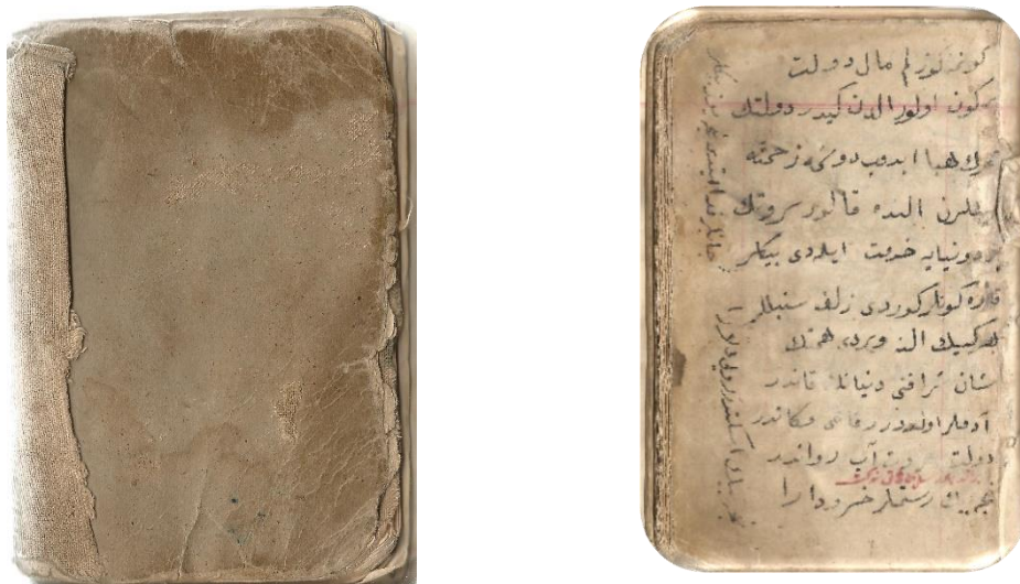
EK-2: Defter 1'in ön kapağı ve ilk sayfası