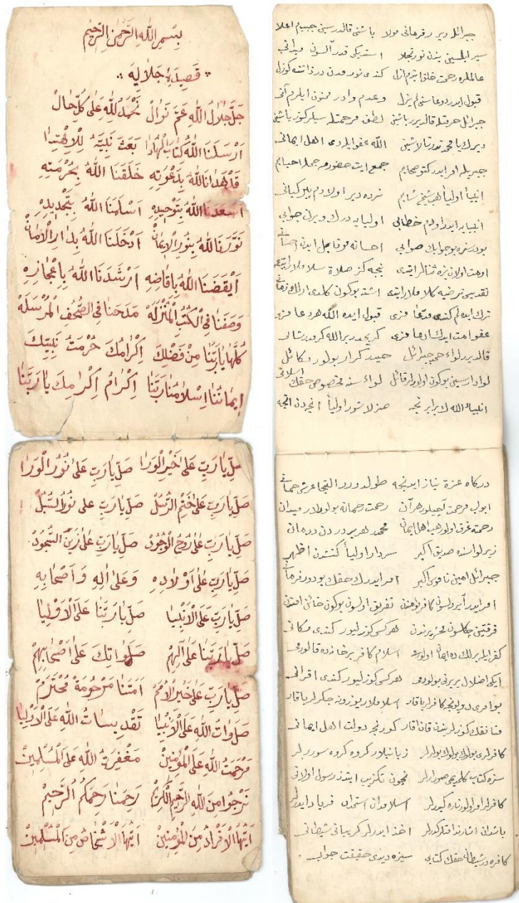
EK-4: Defter 7'de bulunan 1b-2a numaralı ve defter 8'de bulunan 2b-3a numaralı sayfalar