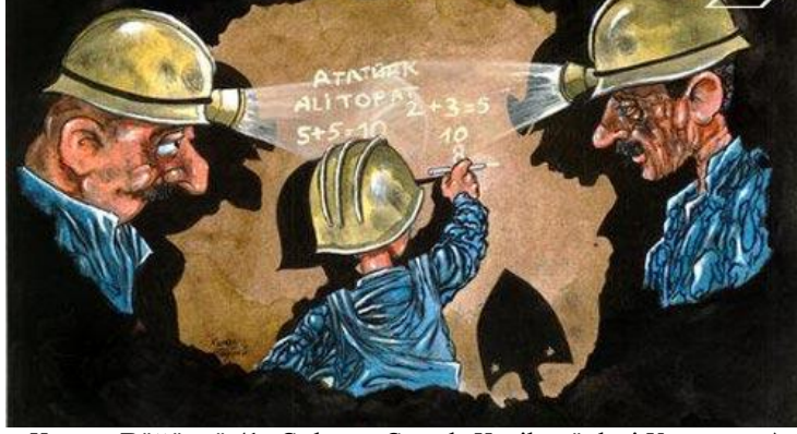
Kenan Böğürücü (1. Çalışan Çocuk Karikatürleri Yarışması)