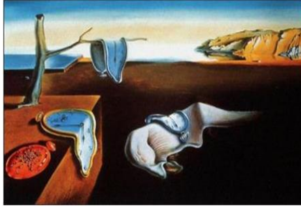
Yumuşak Saatler ya da Eriyen Zaman (Dali, 2010: 29)

Öğretmenin, öğrencilere bir resmi yansıtıcı yardımıyla göstererek “Yansıda gördüğünüz resimden yola çıkarak bir sonraki dersimizde ele alacağımız konuyu çıkarsamaya çalışın.” demesi.