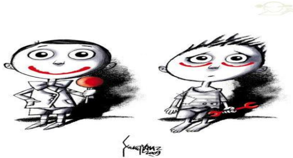
Şevket Yalaz (1. Çalışan Çocuk Karikatürleri Yarışması)

Aşağıdaki karikatürlerin size duyumsattıklarını altlarında yer alan boşluklara yazınız (İstekli öğrencilere yazdıkları okutulur. Öğrencilerin yazıları değerlendirilir. En iyi yazan öğrenciye pekiştirme verilir.)