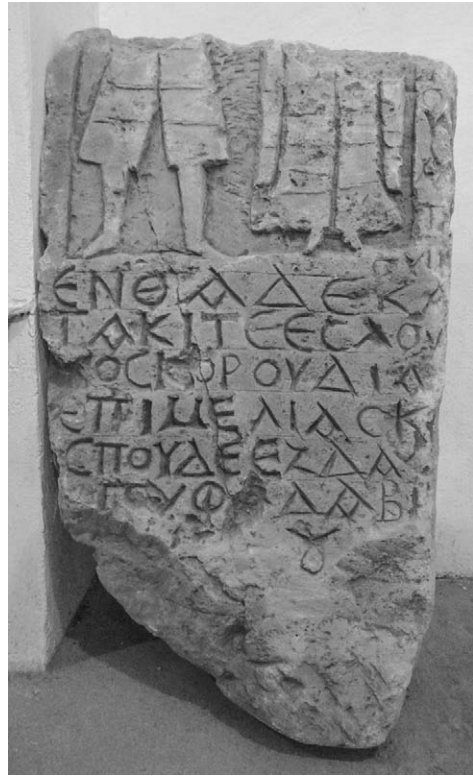
Рис. 8. Средневековый лапидарный памятник из коллекции И.К. Суручана.

Лапидарные исламские памятники составляют довольно внушительную часть коллекции.