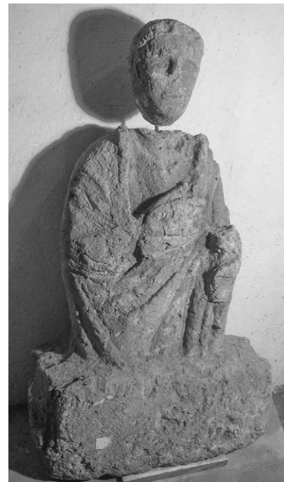
Рис. 7. Мужская полуфигура из коллекции И.К. Суручана.

вителем О.Х. Горонович в деле продажи коллекций ее мужа. Он и сообщил В.И. Гошкевичу, что недостающие фрагменты скульптуры, отсутствовавшие и в собрании И.К. Суручана, находятся в Одессе. Через семь лет, в конце 1924 г., преемница В.И. Гошкевича на должности хранителя Херсонского музея древностей И.В. Фабрициус посетила Одесский археологический музей и добилась передачи недостающих фрагментов «ольвийского льва» в Херсон.