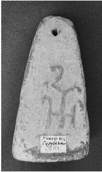
Рис. 4. Античное грузило из коллекции И.К. Суручана.