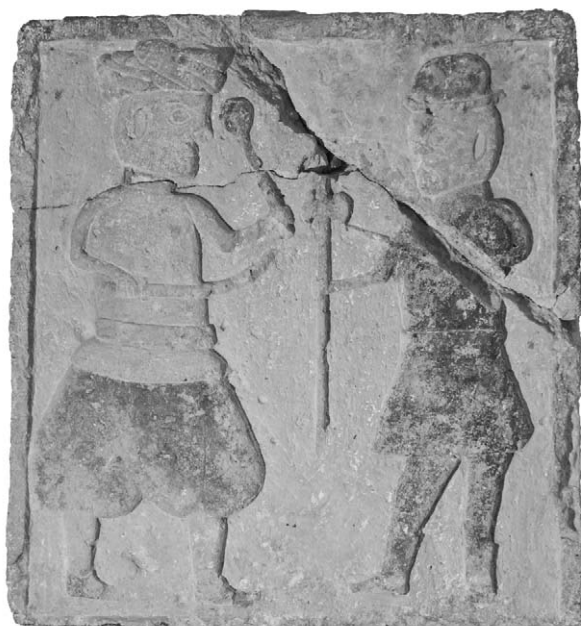
Рис. 10. Османская плита с изображением поединка из коллекции И.К. Суручана.