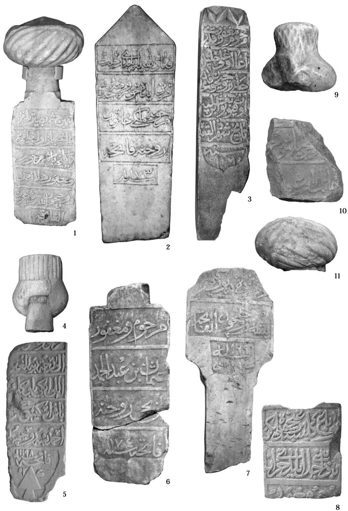
Рис. 9. Исламские лапидарные памятники из коллекции И.К. Суручана.