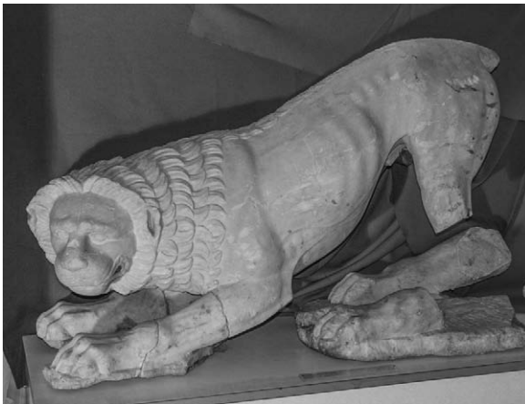
Рис. 6. Скульптура льва из Ольвии из коллекции И.К. Суручана.