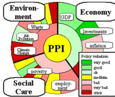
Figura nr. 1 Reprezentare sumară de ansamblu a Indexului Politicii de Performanță (PPI) pe baza obiectivelor și indicatorilor de sustenabilitate

Indiferent de forma de abordare și prezentare, tabloul de bord al sustenabilității reprezintă o imagine interactivă globală destinată să orienteze organizațiile și comunitățile către progres socio-cultural și economico-financiar. Pentru analiza pe regiuni sau comunități mai extinse este de preferat utilizarea unei hărți interactive a sustenabilității, așa încât compararea pe microregiuni, zone sau locații să se realizeze mai ușor. În Figurile nr. 1 și 2 sunt redată unele imagini sugestive ale diferitelor forme grafice ale unui tablou de sustenabilitate.