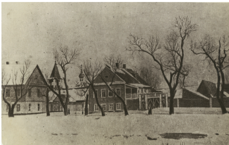
Илл. 4. Дом Достоевских в Старой Руссе. 1881 г.