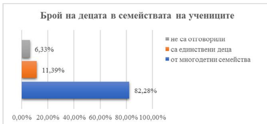
Фигура 2. Брой на децата в семействата на учениците

Значителна част от анкетираните (82,28%) са от многодетни семейства и имат братя и сестри, само 11,39% са единствени деца в семейството, 6,33% не са отговорили ( фигура 2 ).