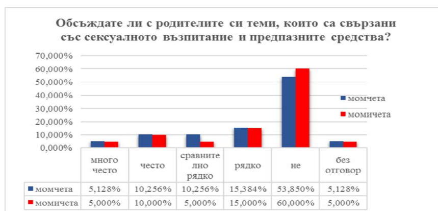
Фигура 7. Честота на обсъждане в семейството по въпроси свързани с предпазните средства

Почти 60% от момичетата не обсъждат с родителите си въпроси, свързани със сексуалното възпитание и предпазните средства, 15% рядко обсъждат тези теми с родителите си, 5% – сравнително рядко, само 10% – често и 5% – много често разговарят в семейството, а 5% не са отговорили.