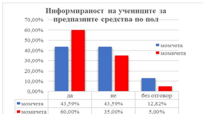
Фигура 4. Информираност на учениците за предпазните средства по полова принадлежност

Във връзка с тази традиция в ромската общност данните от отговорите на въпросите, свързани с предпазните средства за превенция на заболяванията предавани по полов път и разговорите с родителите по тази тема, личната мотивация за продължаване на образованието, както и мотивацията, която получават от семейството си, ще се сравнят и анализират и по полова принадлежност.