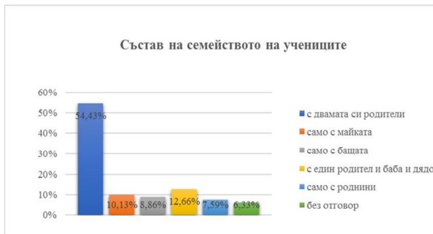
Фигура 1. Състав на семейството на анкетираните

Малък дял от респондентите живеят без родителите си, а с други родственици – 2,53% само с баба и дядо, 5,06% посочват, че живеят с баба и сестри, чичо и леля, майка и лели, 6,33% не са отговорили на този въпрос (вж. фигура 1 ).