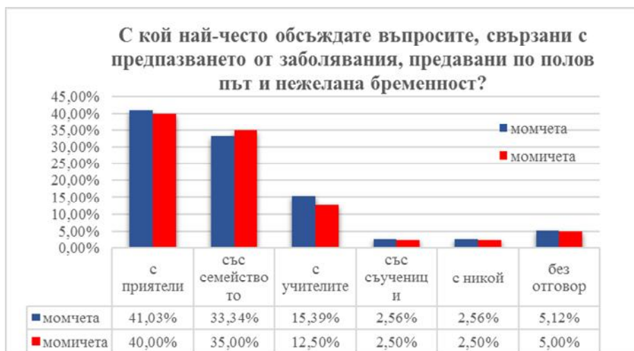
Фигура 6. Лица, с които анкетираните обсъждат въпросите свързани с предпазните средства

Както при момчетата, така и при голяма част от момичетата (40%) тези въпроси се обсъждат най-често с приятелите, 35% от респондентите разговарят по тези теми в семейството, 12,5% получават информация от учителите, 5% от момичетата споделят със съучениците си, едно момиче не обсъжда с никого и 5% не са отговорили. Притеснително е, че само една малка част от учениците се информират в училище по теми, свързани с предпазните средства.