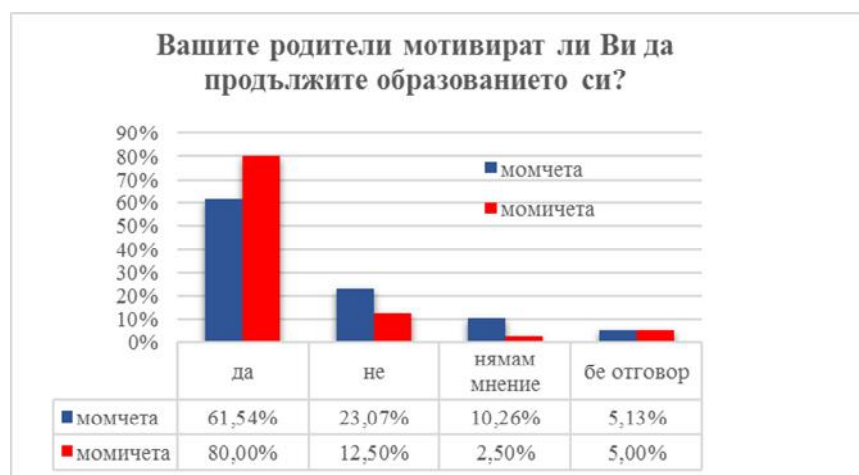
Фигура 8. Мотивиране на учениците от страна на родителите

От получените данни може да се направи изводът, че повечето от родителите на момичетата ги мотивират и подкрепят, за да продължат образованието си, в сравнение с родителите на момчетата, което е в противоречие с действителното положение и имайки предвид традициите на етноса. Може да се отчете като положителен факт и да се допусне, че родителите са започнали да осъзнават изключителното значение на образованието за успешния старт в живота на техните деца.