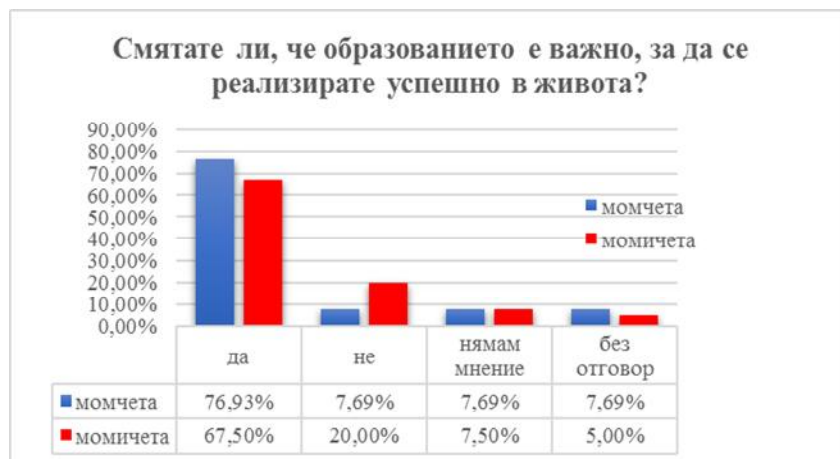
Фигура 10. Образованието като фактор за успешна реализация според учениците

съжаление 20% от тях посочват, че образованието няма връзка с успешната реализация, 7,5% нямат мнение, а 5% не са отговорили (фигура 10).