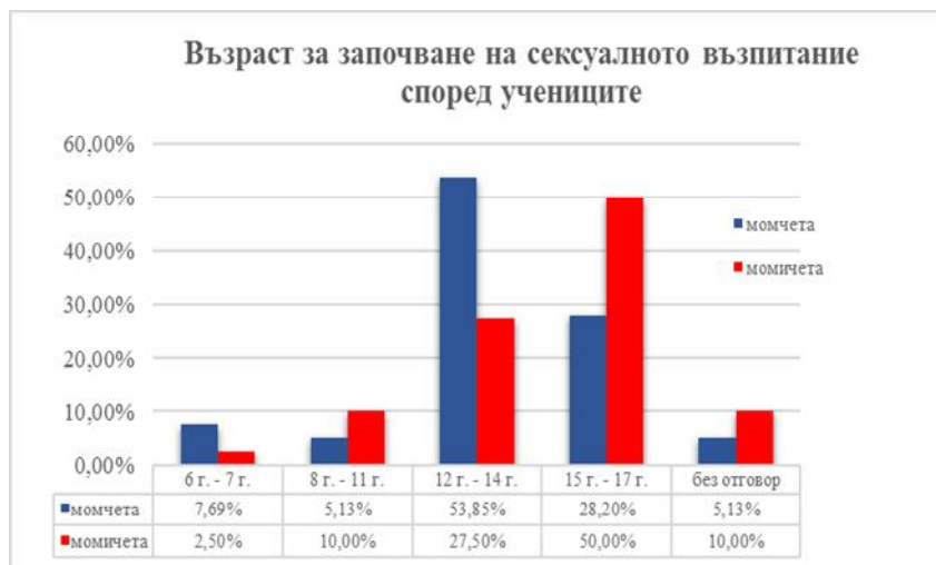
Фигура 5. Възраст за започване на сексуалното възпитание според учениците

Интересен е фактът, че момичетата дават по-висока възрастова граница, на която да започне обсъждането на тези теми с родителите, независимо че тяхното съзряване започва много по-рано, отколкото при момчетата.