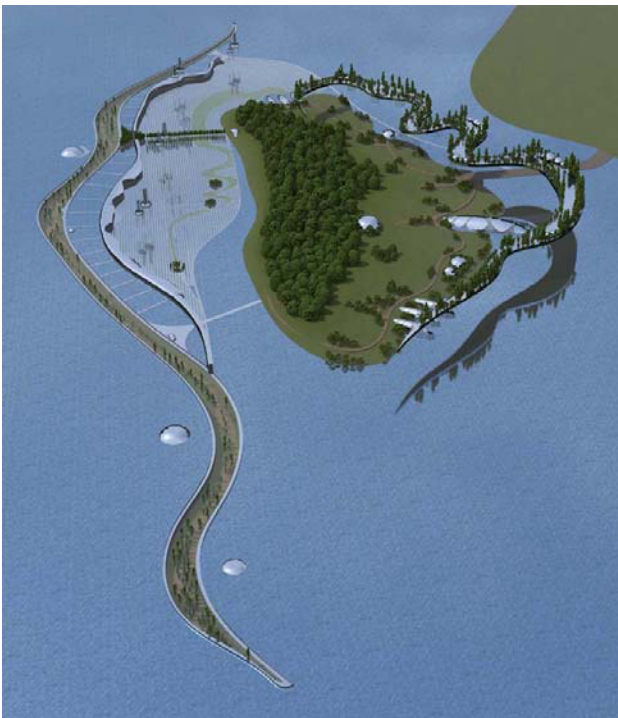
Рис. 2. Остров Кодачок в окружении периметральных акваферм свайно-наплавного и погружного типа, а также лентовидных ферм с «нулевой плавучестью» в атмосфере

приречных трав. Отличительной особенностью их производства является то, что оно не требует больших строений, превращающих остров в урбанизированную зону, вытеснившую естественную природу. Они могут размещаться в «растворившихся» в природе прозрачных фермах. Фермах, «невидимых» со стороны, не занимающих много места, дающих продукцию круглый год и не требующих сложных и дорогостоящих технологий. Их инвестиционная привлекательность высока. Проблема лишь в том, что нет понимания, насколько выгодно заниматься этим направлением бизнеса (рис. 2, рис. 3).