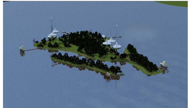
Рис. 3. Пример архитектурно-ландшафтной организации острова им. Ленина, основанной на использовании объектов «нулевой плавучести» в воздушном бассейне, в том числе - крондендроорбиталей - не воспринимаемых с внешних пространств, не передающих нагрузки на деревья, не создающих экологических проблем

человеческого организма, не имеют себе конкурентов в мире. Крапивный кремний упоминается едва ли не во всех древних мифах, повествующих о лечебных рубахах, дающих к тому же большую силу воинам. Что, между прочим, и использовалось в армиях Западной Европы до 50-х годов XX века, и снова возвращается на «круги своя».