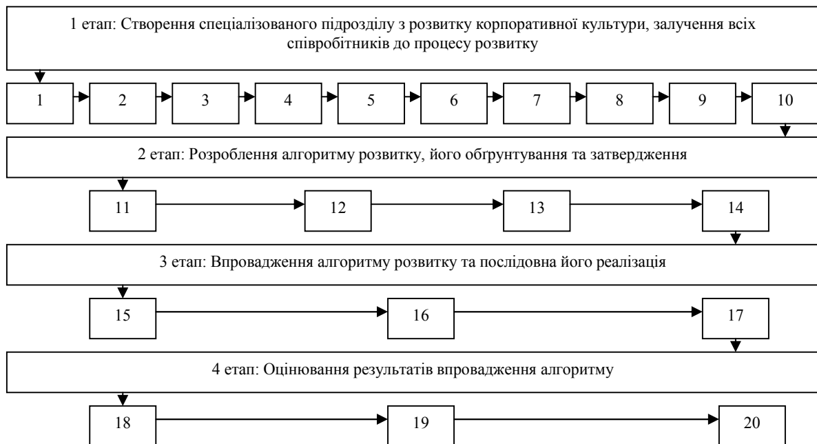
Рис. 1. Алгоритм розвитку корпоративної культури на машинобудівних підприємствах

типових дій з розвитку корпоративної культури, характерних більшості машинобудівних підприємств України.