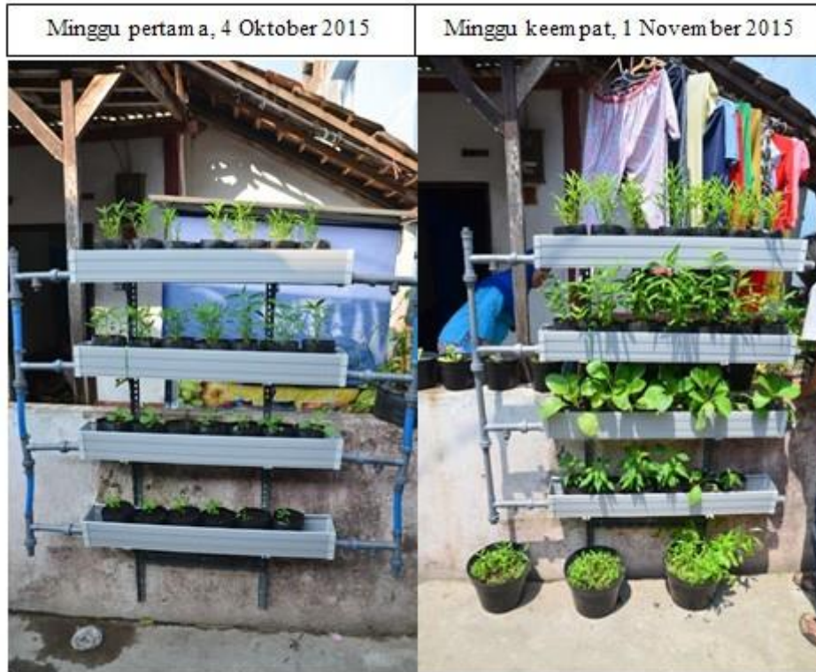
Gambar 7 Pengamatan terhadap eksperimen budi daya tanaman menggunakan sistem pengairan terhubung selama 4 minggu