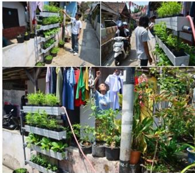
Gambar 6 Aktivitas warga saat menggunakan sarana tanam dengan sistem pengairan terhubung satu titik

memungkinkan warga untuk melakukan aktivitas sehari-hari seperti menjemur pakaian, bersosialisasi dengan tetangga, maupun bekerja bersama dengan aktivitas menyiram tanaman. Selain