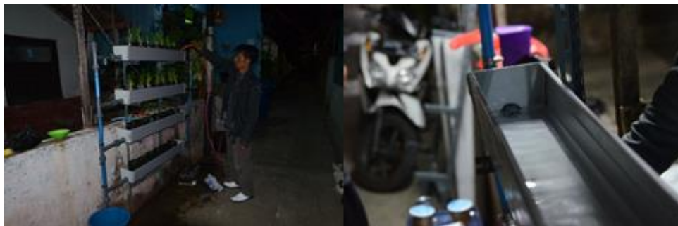
Gambar 5 Uji coba pengairan

tersebut didapati adanya perubahan perilaku menyiram tanaman yang lebih rutin dilakukan oleh warga. Hal ini dapat diindikasikan dari pertumbuhan tanaman yang membaik. Jika dilihat perkembangan dari minggu pertama hingga minggu ke-4, tidak ditemukan adanya permasalahan pada tanaman yang dibudidayakan pada sarana tanam ini.