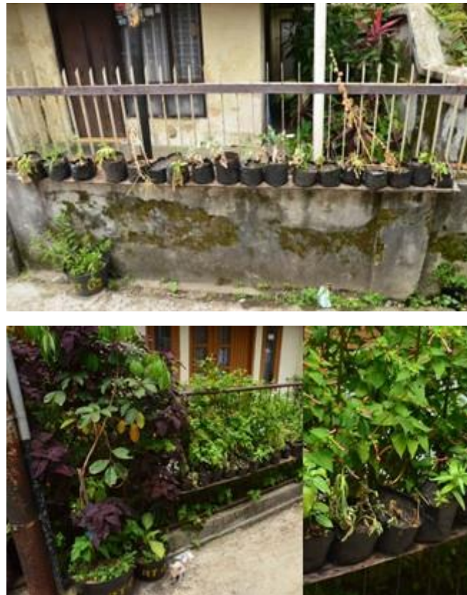
Gambar 1 Survei lokasi tahun 2015 mengenai kondisi budidaya tanaman sayuran pada wilayah studi kasus RT 2 RW 2 Kelurahan Kacapiring, Kota Bandung

Dari pengamatan yang dilakukan penulis terhadap aktivitas menyiram tanaman sehari-hari, dapat dirumuskan pada tabel I. Dari tabel tersebut, dapat terlihat bahwa konsumsi waktu yang diperlukan untuk menyelesaikan aktivitas menyiram tanaman adalah selama maksimal 20 menit pada 52 pot tanaman. Aktivitas ini cukup menyita waktu sehingga dibutuhkan pengembangan sistem pengairan tanaman pada sarana tanam vertikal agar didapatkan efisiensi waktu