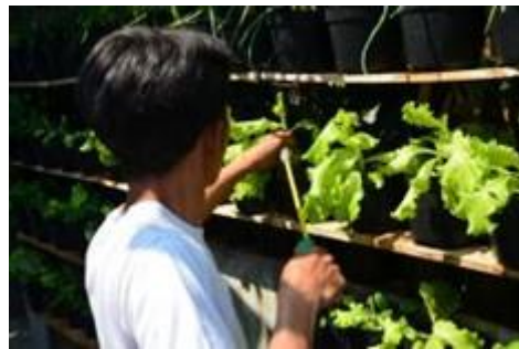
Gambar 3 Aktivitas menyiram tanaman dengan peralatan selang air pada setiap pot tanam yang biasa dilakukan warga RT 2 RW 2 Kelurahan Kacaping, Kota Bandung tahun 2015

yang diharapkan dapat memengaruhi perilaku warga dalam aktivitas menyiram tanaman.