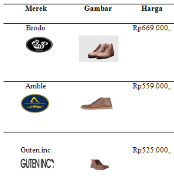
TABEL I PERBANDINGAN HARGA SEPATU BAHAN KULIT JENIS CRAZYHORSE

Tabel I memperlihatkan salah satu kelebihan yang dimiliki oleh Guten.inc yaitu menawarkan harga yang lebih murah bila dibandingkan dengan beberapa merek sepatu kulit yang dianggap memiliki level yang sama. Kelebihan lain yang dimiliki oleh Guten.inc juga terletak pada desain produk yang berkonsep westren style serta inovasi yang dilakukan oleh Guten.inc dengan menyediakan layanan transaksi pembelian dan pembayaran melalui website . Salah satu media yang menjadi tempat penjualan produk Guten.inc adalah media sosial instagram. Salah satu tim pemasaran dari Guten.inc, Ramadhan, mengatakan instagram merupakan media yang sangat tepat untuk dijadikan sarana penjualan pada saat ini. Hal itu diperkuat dengan data yang diterbitkan oleh Markeeters (2014) yang menyatakan, sebanyak 75% dari pengguna instagram berasal dari luar Amerika Serikat, dengan mayoritas berasal dari wilayah Eropa dan Asia. Tercatat Brazil, Jepang, dan