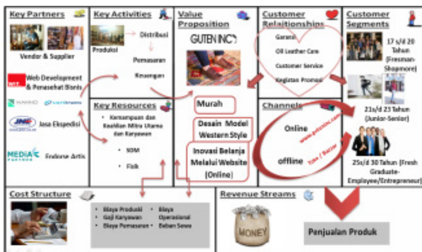
Gambar 2 Model Bisnis Existing Guten.inc

Peneliti melihat tidak perlunya media sosial facebook dalam hal memperkenalkan produk karena kurang efektif. Hal itu didukung oleh data SumAll yang merupakan sebuah lembaga analisis yang di dalam laporan akhir tahunnya, pada tahun 2013 mendapatkan hasil instagram merupakan jejaring sosial yang paling efektif dalam meningkatkan bisnis. SumAll juga menyertakan tiga jejaring sosial lain, seperti facebook, google+, dan juga twitter. Di dalam laporan tersebut dikatakan bahwa, instagram merupakan satu-satunya layanan yang berbasis aplikasi mobile dan dinyatakan sebagai media sosial yang paling cepat menciptakan follower/ pengikut baru. Hal itu tentu sangat baik