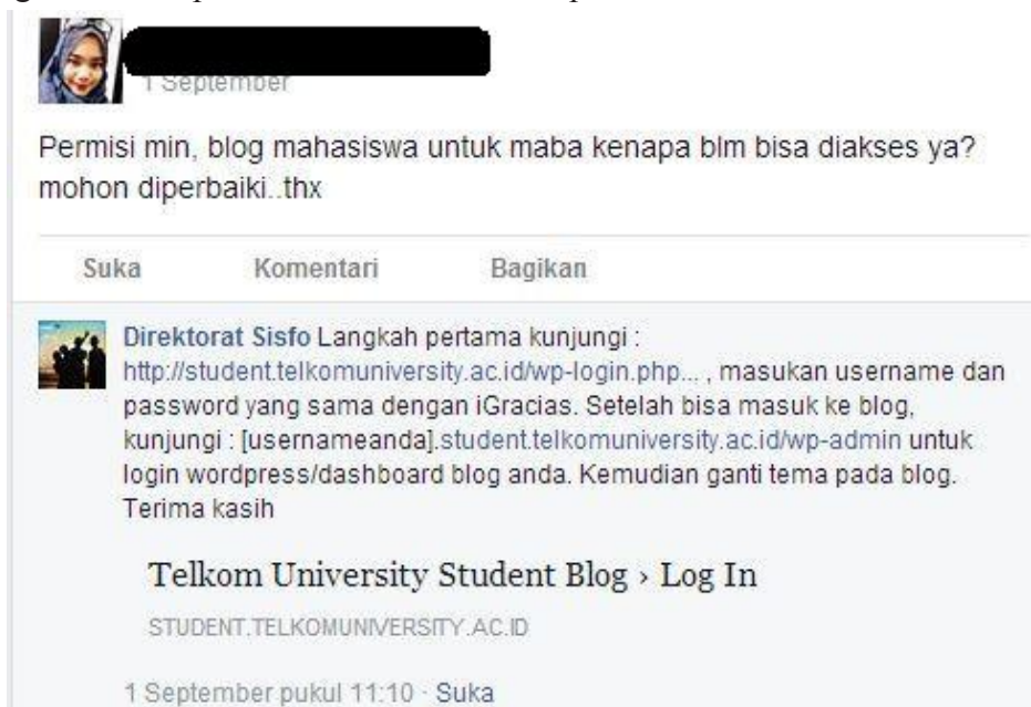
Gambar 1 Respons direktorat Sisfo dalam penanganan keluhan

Melihat kepuasan pelanggan (mahasiswa) yang berhubungan dengan penanganan keluhan berbasis media sosial yaitu grup Facebook Helpdesk Direktorat Sisfo, terdapat beberapa hal yang menjadi indikator untuk menilai kepuasan mahasiswa. Indikator tersebut