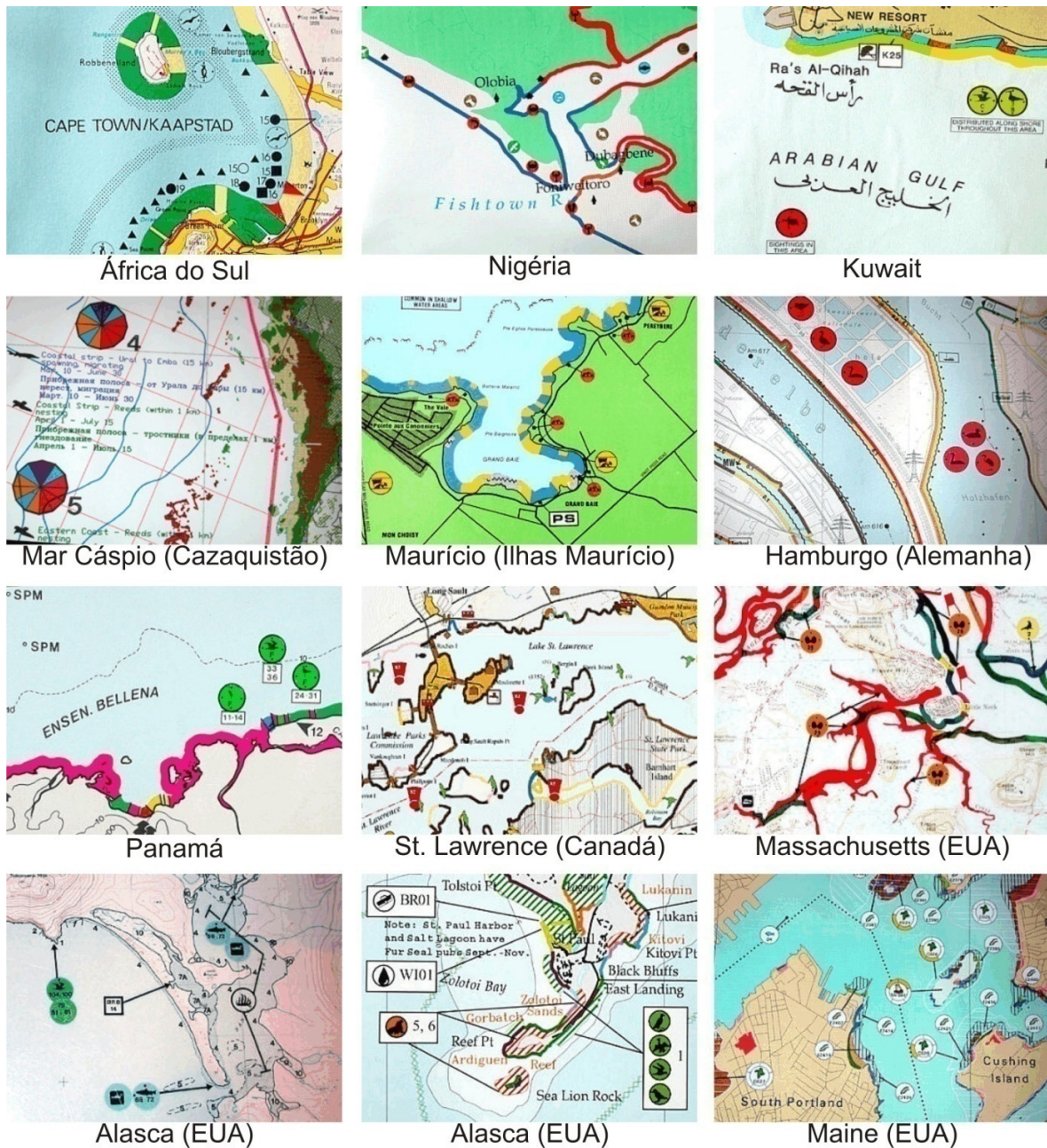
Figura 1. Exemplos de representação de Cartas de sensibilidade a óleo em diferentes lugares do mundo.

subsídio à elaboração das “Especificações e normas técnicas para a elaboração de cartas de sensibilidade ambiental para derramamentos de óleo” (MMA, 2002; MMA, 2004; ARAUJO et al., 2006), documento referência ao mapeamento dos índices de sensibilidade ambiental ao óleo no país. Foi neste documento que foi instituída a ferramenta CARTAS SAO (Cartas de sensibilidade ao óleo) no Brasil.