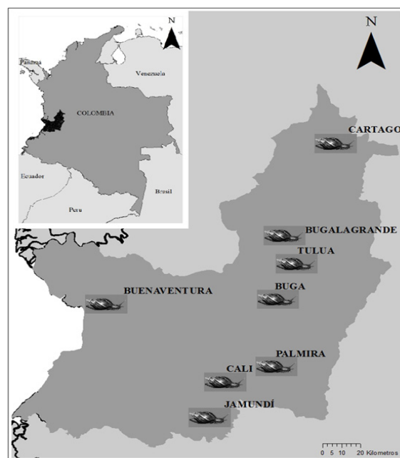
Figure 1. Geographic location of giant African snail Achatina fulica sample plots in the Valle del Cauca Department.

El caracol africano como especie invasora, presenta a nivel genético el mismo comportamiento que las demás especies invasoras (13-15): una baja en la diversidad génica respecto a las poblaciones en su rango natural de distribución en África, debido al efecto fundador que ocurre en cada evento de introducción, y a los cuellos de botella subsiguientes al establecimiento y aclimatación a las condiciones del nuevo hábitat (1,4). Aunque desde el punto de vista ecológico las poblaciones de A. fulica en las etapas iniciales de invasión pueden considerarse exitosas, cuando la invasión lleva varias décadas la dinámica poblacional tiende a estabilizarse o incluso puede llegar a decaer de forma natural (1,15). Para explicar este fenómeno se han formulado varias hipótesis, desde causas genómicas, de amplia plasticidad fenotípica, comportamentales o múltiples introducciones que compensan la deriva génica en la que entran los individuos fundadores (14,15).