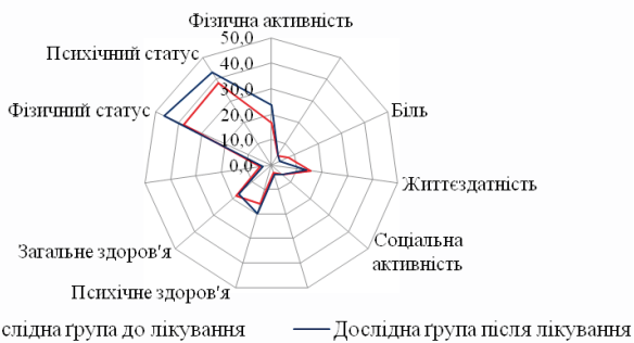
Рис. 2. Оцінка стану здоров'я за результатами анкетування опитувальника MOS SF-36 у хворих дослідної групи до та після лікування.

Хворі ДГ після лікування також підтвердили достовірне ( p < 0,01 ) покращення загального здоров'я ( 17,2 \pm 0,4 бала), чого не зауважили хворі КГ. Однак хворі обох груп оцінили стан здоров'я до та після лікування порівняно з тим, що було рік тому – без достовірних змін. Показник фізичного статусу у хворих ДГ до лікування становив 37,9 \pm 1,8 бала, після лікування – 46,4 \pm 1,3 бала, що статистично достовірно відмінне ( p < 0,01 ) у групі та порівняно з результатом КГ після лікування ( 36,8 \pm 1,6 бала), у яких не було достовірної різниці. На 43,1 \pm 0,2 бала хворі ДГ оцінили свій психічний статус після лікування, що достовірно ( p < 0,05 ) краще, ніж до лікування ( 38,4 \pm 0,3 бала) та порівняно з результатами КГ ( 38,1 \pm 0,3 ; p < 0,001 ). Хворі КГ не відзначили будь-яких змін психічного статусу після лікування.