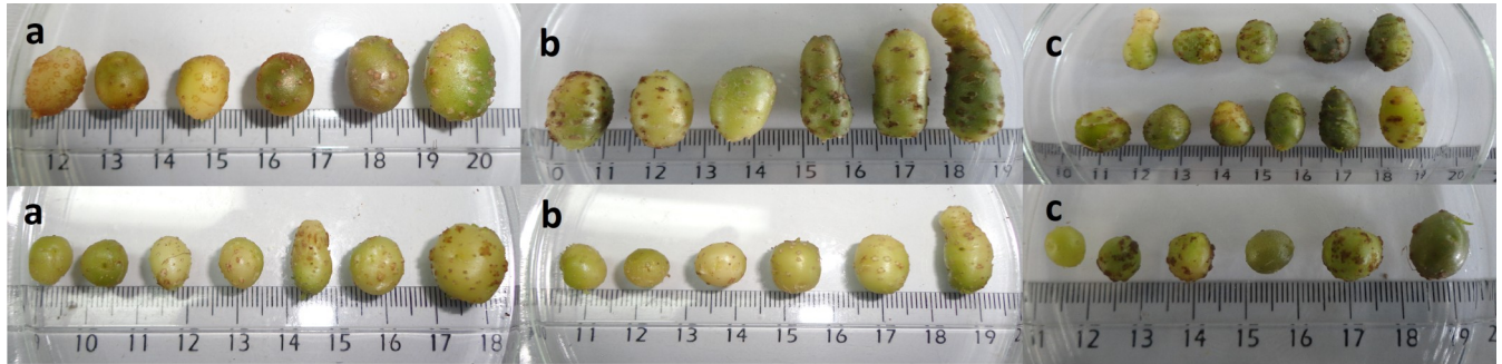
Figura 2. Microtubérculos de G (arriba) y AN (abajo), incubados bajo condiciones fotoperiódicas, cosechados de vitroplantas pre-tratadas con GA y subcultivadas en MS suplementado con BA: a) 0 mg/L, b) 1mg/L, c) 5mg/L.

tarea debido a múltiples factores. Entre ellos destacan el efecto de hormonas vegetales tales como BA y GA (Zhang et al. , 2005; Aksenova et al. , 2011). Las GAs promueven la elongación de los vástagos permitiendo de esta manera la formación de un mayor número de microtubérculos desde la base hasta el ápice de las plantas, mientras que las citoquininas inducen posteriormente la división celular y la formación de los microtubérculos. El fotoperiodo es otro de los factores que promueve la microtuberización en papa, promoviendo la morfogénesis de dichos órganos de almacenamiento cuando las plantas son cultivadas bajo días cortos (Igarza et al. , 2012).