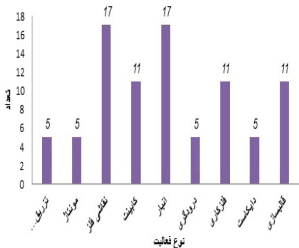
نمودار ۲: فراوانی حالت نقص در قسمت‌های مختلف در سال ۱۳۹۳