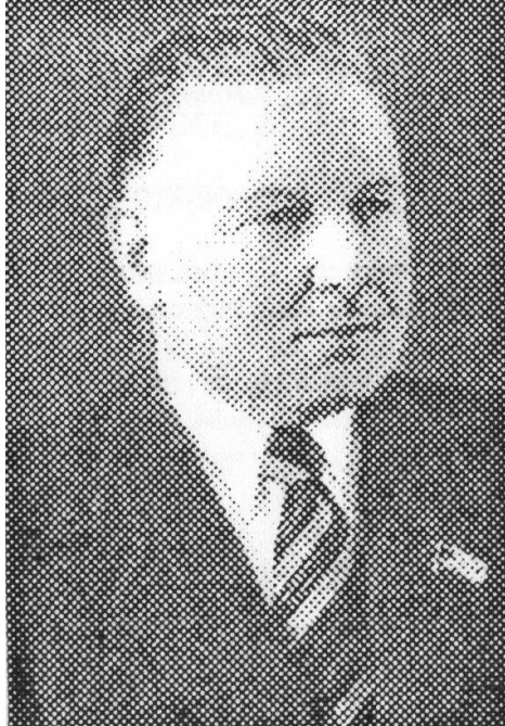
Академік АН України Кирило Федорович Стародубов

закордонними підприємствами. Інститут чорної металургії АН України зробив великий внесок у розвиток металургійної науки, у створення та введення у металургійне виробництво нових ефективних технологій. ІЧМ було визнано головним науково-дослідним інститутом у Радянському Союзі.