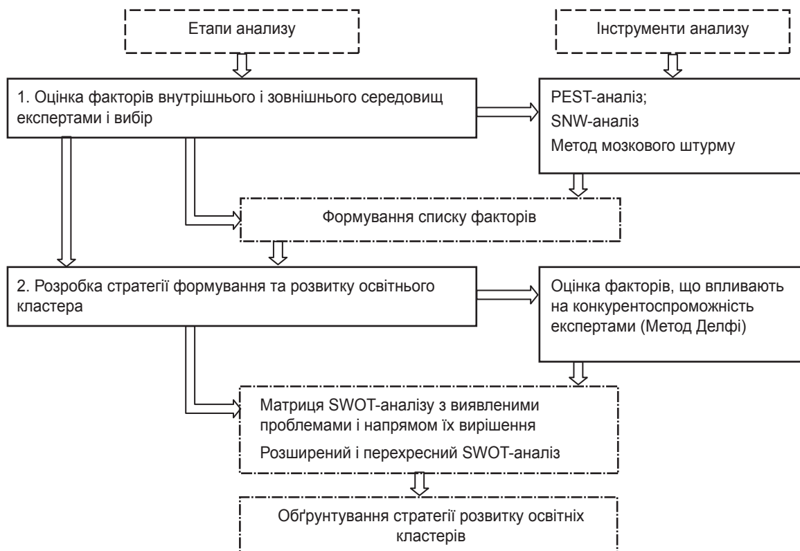
Рис. 2. Послідовність оцінювання конкурентоспроможності факторів внутрішнього і зовнішнього середовищ у процесі створення освітнього кластера*