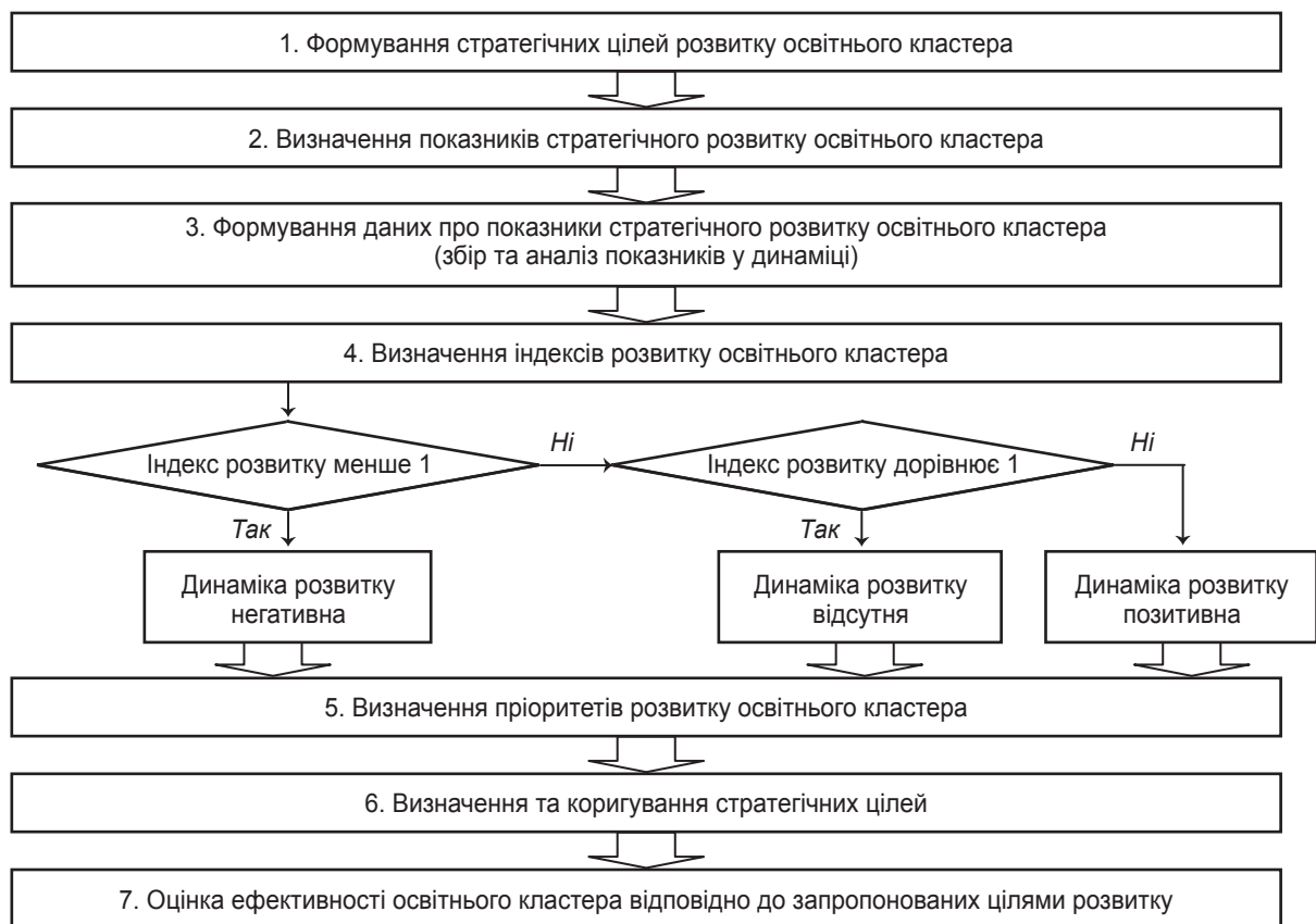
Рис. 3. Послідовність визначення пріоритетних напрямів стратегічного розвитку освітнього кластера

На підставі обраної стратегії розвитку освітнього кластера необхідно сформулювати конкретні цілі, які повинні бути досягнуті. Послідовність визначення пріоритетних напрямів стратегічного розвитку освітнього кластера наведено на рис. 3.