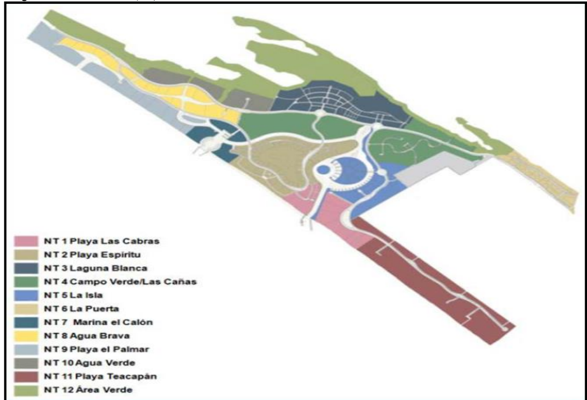
Imagen 3. Sectores urbanos proyectados en el CIP-CP.

En el año 2007 empezaban a circular públicamente las primeras notas sobre el entonces llamado Centro Integralmente Planeado Costa-Pacífico (CIP-PE), sin embargo sería hasta en septiembre del 2008, en el marco de la Expo Mexicana de Inversión