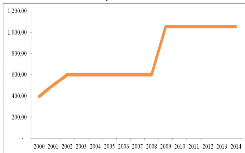
Graficul 1: Evoluția rezervei de aur a Chinei

Rezerva de aur a Chinei a crescut de 2,66 ori din 2000 până în 2014, de la 395,01 tone, la 1.054,09 tone, asigurându-i locul 6 în clasamentul țărilor cu cele mai mari rezerve, după SUA, Germania, Italia, Franța și Federația Rusă. În același interval, doar India, Japonia și Federația Rusă au înregistrat creșteri ale rezervei de aur.