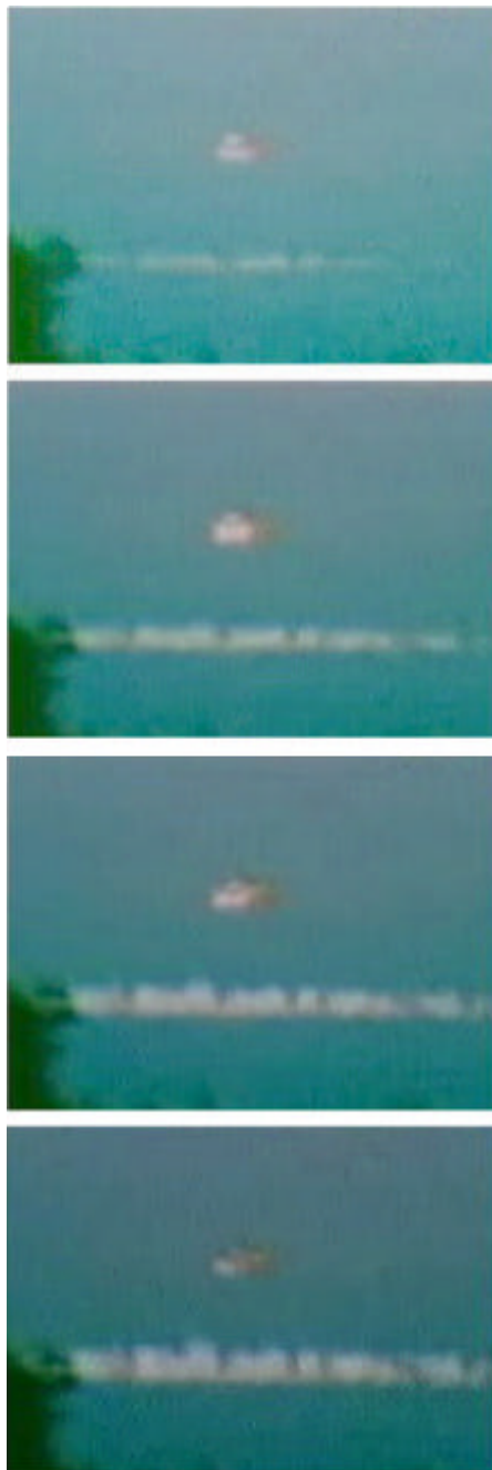
Sl. 1 – Snimak dejstva blizinskog upaljaca

Princip merenja visine dejstva blizinskog upaljaca prikazan je na slici 2. Iz slicnosti trouglova KEV i KE_1V_1 dobija se jednačina za određivanje visine dejstva projektila sa blizinskim upaljacem: