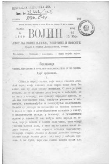
Слика 2 – Војин, „лист за војничке науке, вештине и новости“

Иако је излазио као приватни војни лист и искључиво зависио од новца добијеног од „пренумераната“ (претплатника – прим. И. М.), потреба за војном писаном речју дубоко се укоренила међу српске официре. Због учесталих финансијских проблема, иако „насушна потреба“ Војин се након 6 година постојања једноставно угасио 1870. године. 2 Као прво војностручно гласило у Србији и на Балкану, с правом се „у освиту српске војне периодике“ тај лист може сматрати симболом војничког сазревања који је однеговао „прве самосталне зачетнике српске војне мисли“. 3 У Војину је пронађена књига почетница из које ће се срицати основни појмовник у теорији ратне вештине. 4 Војин ће својим читаоцима дати и прве појмове о наоружању и ратној техници свога доба. Ова „књига почетница“ пружиће основне податке о црном баруту, пушкама спредњачама, острагпунећим пушкама, пушкама жлебушама, иглењачама, али и о топовима, ракетним топовима, олученим топовима, упаљачима за артиљеријску муницију, средствима везе, па чак и бродовима.