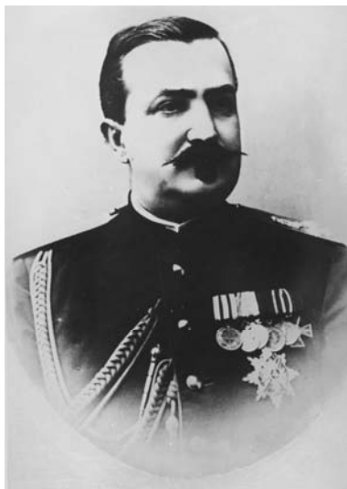
Слика 3 – Министар војни, ђенералштабни потпуковник Јован Мишковић

Боравећи у Нишу, у обиласку новоослобођених територија, Мишковић са својом идејом и одлуком о покретању „војног листа“ обавештава тадашњег начелника ђенералштаба, наредбом Ф№ 408. од 6. јануара (18. јануара по новом календару) 1879. године. У својој наредби Мишковић је изрекао мисао која је и данас актуелна: „Војска без свога листа као човек без говора“. Полазећи од става да је доста „времена прошло од како је наша војска без свога гласила, без свога листа“, те да је „у времену када се наша војска, на основу стечених искустава бојних, има да препороди и учврсти, војни лист нам је и неоспоран и неопходан“, Мишковић даје и основне смернице за издавање листа.