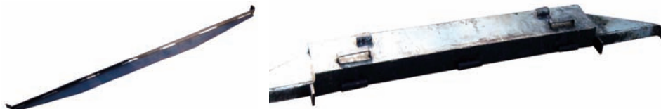
Slika 5 – Poprečni i prednji nosač Figure 5 – Transversal carrier and front carrier

Prednji nosači (sl. 5) postavljaju se napred do prednje stranice peći. Njihova namena je da nose vratanica i opeku. Izrađeni su od kotlovskog čelika i otporni su na visoke temperature.