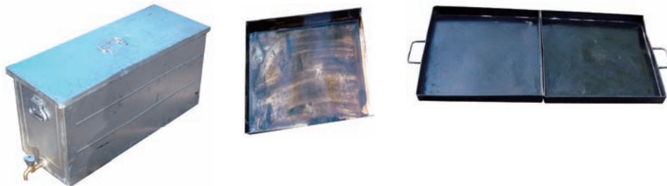
Slika 9 – Rezervoar, pleh za testo i pleh za pepeo Figure 9 –Tank, baking tray and fire pit pan

Cev služi kao nastavak dimnjaka. Izrađena je od tankog čeličnog lima. Na vrh cevi postavlja se kapa dimnjaka koja sprečava izbijanje plamena i žara kroz dimnjak, kao i upadanje kiše.