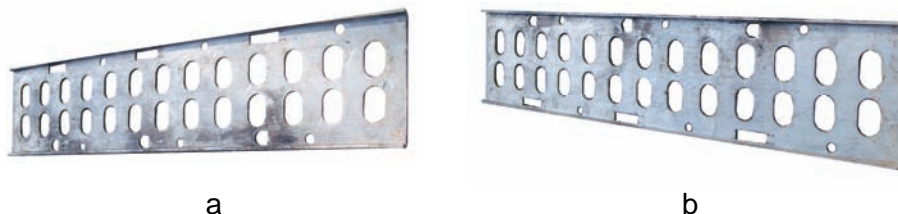
Slika 2 – Stranica prednja a) leva; b) desna Figure 2 – Front side a) left b) right

Prednja i zadnja stranica (sl. 2) izrađene su od osam milimetara debele aluminijumske ploče koja je na krajevima savijena radi čvrstoće, a rupe služe za nošenje šipkastih spojnih elemenata i radi olakšanja delova.