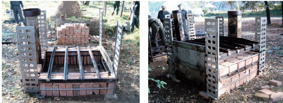
Slika 12 – Zidanje peći Figure 12 – Masonry work

Kada se ozida plafon najviše etaže oba rezervoara na zidni deo peći od dimnjaka, tako da oba priključka budu spolja. Nakon toga preko gornje etaže treba nabaciti 20 do 25 cm suve zemlje, ravnomerno po celoj površini. Prostor između zadnjih stranica treba poravnati sa gornjom ivicom stranica i blago utabati. Na taj način zidanje peći je završeno.