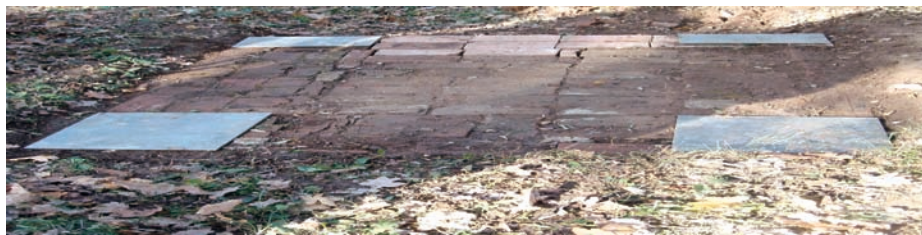
Slika 10 – Raspored stopa Figure 10 – Position of feet

Na način kako je prikazano na sl. 10 rasporede se prednje i zadnje stope. Ako na raspolaganju stoji dovoljno cigli preporučuje se da se čitava površina ispod peći, pre postavljanja stopa, poploča položenim ciglama. Na taj način osigurava se dobra termička zaštita donje etaže peći.