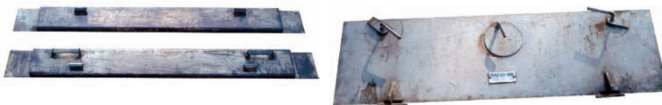
Slika 6 – Nosač vratanaca peći i pokretna vratanica Picture 6 – Carrier latch furnace and Movable door

Nosač vratanaca peći (sl. 6) postavlja se napred do prednje stranice na patos. Izrađen je od kotlovskeg čelika i otporan je na visoke temperature.