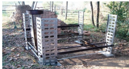
Slika 11 – Postavljanje kostura peći Figure 11 – Assembling the prefabricated body