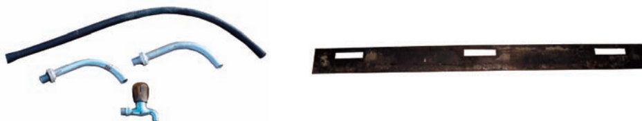
Slika 7 – Gumeno crevo i štitnik Figure 7– Rubber hose and Protecting element

Gumeno crevo (sl. 7) namenjeno je za spajanje aluminijumskog rezervoara i rezervoara koji je u sastavu dimnjaka (protočni bojler). Štitnik (sl. 7) postavlja se ispod nosača koji formira okvir vrata svake etaže. Postavlja se za vreme zidanja peći. Namena mu je da zadrži topli vazduh iz peći, a time i toplotu u toku pečenja.