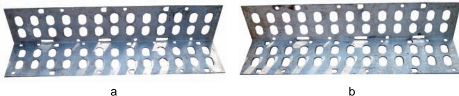
Slika 3 – Stranica zadnja a) leva, b) desna Figure 3 – Rear side a) left b) right

Spojne cevi (sl. 4) služe za spajanje stranica. Postoje četiri vrste spojnih cevi, od po tri komada. Cevi izrađene od nerđajućeg čelika postavljaju se bliže ognjištu, a cevi od aluminijuma bliže spoljnoj površini peći. Cevi koje imaju usek ili zub blizu svojih krajeva moraju da se uklope u ležišta na stranici. Time se postiže čvrstoća kostura. Pregradne cevi namenjene su za spajanje prednje i zadnje stanice. Cevi od nerđajućeg čelika postavljaju se na unutrašnjoj strani prema vatri, a aluminijumske spolja.