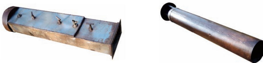
Slika 8 – Dimnjak i cev dimnjaka sa kapom Figure 8– Chimney and a chimney pipe with a cap

Dimnjak (sl. 8) izrađen je od nerđajućeg čelika. U sastavu dimnjaka je i jedan tanak rezervoar koji služi kao protočni bojler.