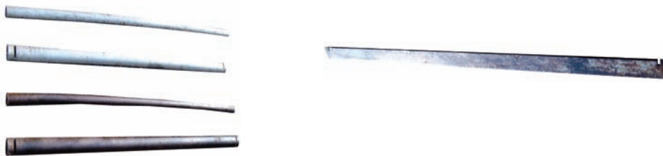
Slika 4 – Spojne cevi i spojna letva Figure 4 – Connecting tubes and a connecting slat

Spojne cevi (sl. 4) služe za spajanje stranica. Postoje četiri vrste spojnih cevi, od po tri komada. Cevi izrađene od nerđajućeg čelika postavljaju se bliže ognjištu, a cevi od aluminijuma bliže spoljnoj površini peći. Cevi koje imaju usek ili zub blizu svojih krajeva moraju da se uklope u ležišta na stranici. Time se postiže čvrstoća kostura. Pregradne cevi namenjene su za spajanje prednje i zadnje stanice. Cevi od nerđajućeg čelika postavljaju se na unutrašnjoj strani prema vatri, a aluminijumske spolja.