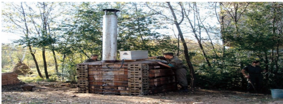
Slika 13 – Zidanje peći ciglom i busenom i završni radovi Figure 13 – Masonry with brick and finishing work

Kada se ozida plafon najviše etaže oba rezervoara na zidni deo peći od dimnjaka, tako da oba priključka budu spolja. Nakon toga preko gornje etaže treba nabaciti 20 do 25 cm suve zemlje, ravnomerno po celoj površini. Prostor između zadnjih stranica treba poravnati sa gornjom ivicom stranica i blago utabati. Na taj način zidanje peći je završeno.