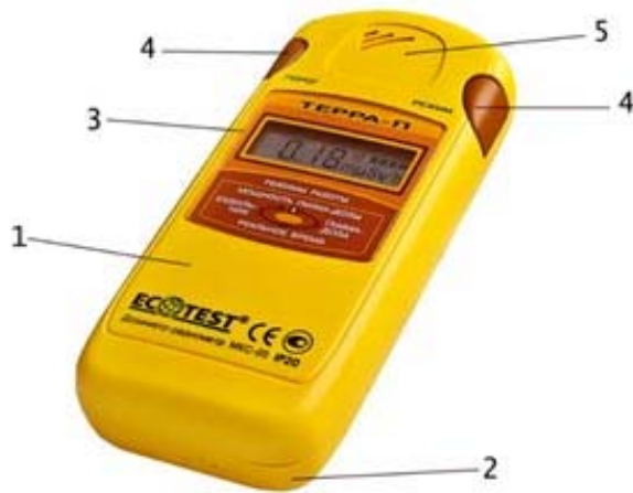
Рис. 1. Дозиметр-радіометр МКС-0,5 «Терра-П»