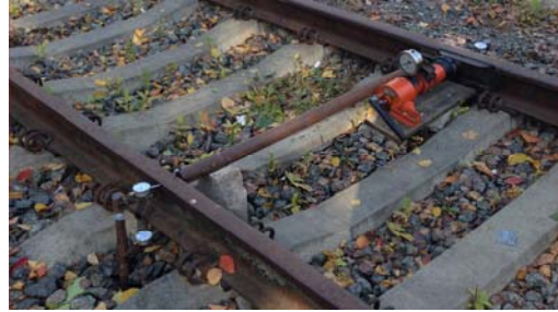
Рис. 1. Загальний вигляд розстановки приладів

Загальний вигляд розстановки приладів при виконанні досліджень з вимірювання поперечної горизонтальної жорсткості рейкових ниток наведений на рис. 1 і 2.