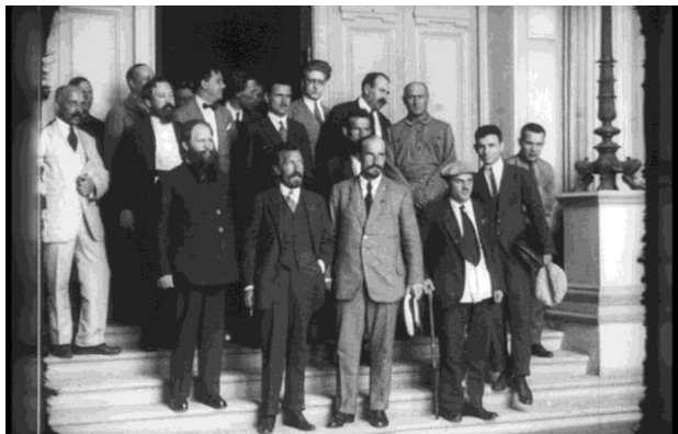
Рис. 1. Члены ярмарочного комитета и правительственной делегации на 2-й Нижегородской ярмарке в 1923 г. В первом ряду А.И. Рыков (первый слева), А.И. Муралов (второй слева), во втором ряду С.В. Малышев (первый слева) [16]

За годы проведения Нижегородской ярмарки на церемонии открытия побывали: председатель правления Госбанка СССР А.Л. Шейнман [7], председатель комиссии СТО В.В. Гомбарг [8], нарком внутренней торговли А.М. Лежава [9], заместитель председателя СТО А.И. Рыков [10], помощник командующего войсками Московского военного округа И.П. Белов [11], поэт и писатель Демьян Бедный [12]. Из иностранных гостей: посол Китая в СССР Ли Тьяо [13], персидский посол Мирза Джафар-хан 2 [14], посол Японии Танака [15].