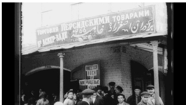
Рис. 7. Одна из лавок персидских торговых рядов Нижегородской ярмарки [27]

Работе Товарной биржи в кинодокументах уделено значительное внимание [26], что вполне объяснимо, ведь именно она являлась центром ярмарочной торговли, необходимым для всех торгующих институтом. На советских ярмарках торговали не только в больших и малых павильонах. – имела место и мелкая розничная лоточная торговля. В кинокадрах видим продавца с огромной связкой воздушных шаров, продавцов леденцов и кренделей, торговку цветами, скромно стоящую напротив большого каменного павильона. Цветы исчезнут из советской торговли вместе с ярмарками в конце 1920-х гг., и только в 1934 г. правительство снова разрешит торговать цветами, а в столице даже можно будет заказать их доставку на дом.