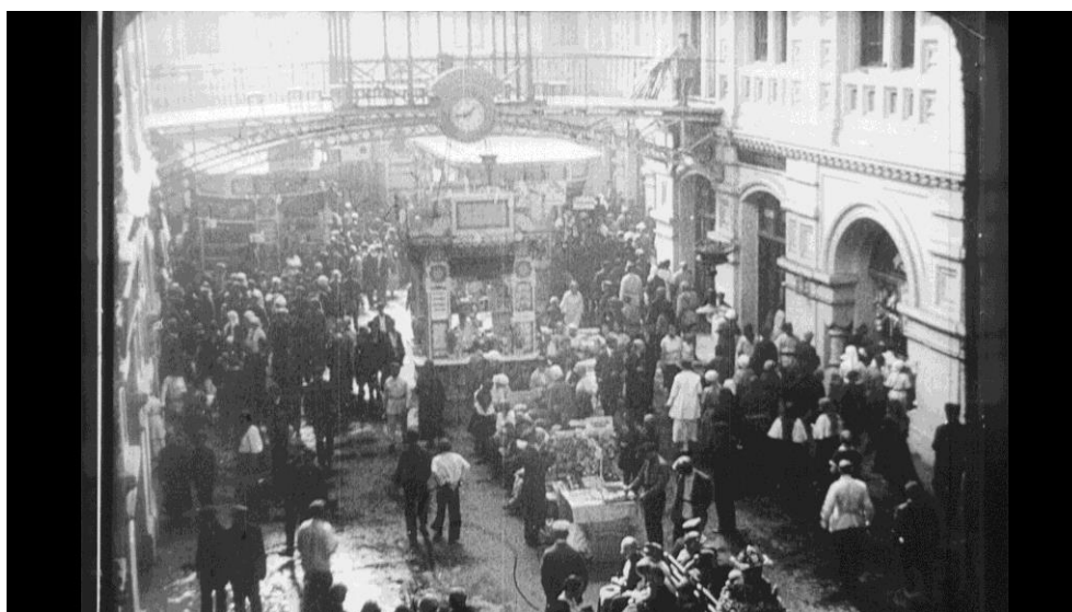
Рис. 4. Внутренний вид Главного ярмарочного дома Нижегородской ярмарки, 1925 г. [19]

С нашей точки зрения, задачи, поставленные перед ярмарками руководством страны, прекрасно отражены в одном из агитационных плакатов, с которого начинается кинофильм, посвященный открытию второй Нижегородской ярмарки. Плакат был выполнен в лубочном стиле и отпечатан тиражом 5000 экземпляров – «Через Нижний укрепляйте связь С.С.С.Р. со странами Востока». На фоне восходящего солнца и расходящихся от него лучей изображен В.И. Ленин, указывающий на здания Нижегородской ярмарки, вокруг которых изображены самые разнообразные товары, и над всем этим изображение серпа и молота в колосьях пшеницы. Первая надпись на плакате несет информацию о сроках проведения ярмарки – «Нижегородская ярмарка 1923 г. 1 августа – 15 сентября», вторая содержит призыв, свидетельствующий о некоторых задачах, возлагаемых советским правительством на Нижегородскую ярмарку: «Укрепляйте торговлю и через торговлю докажете смычку города с деревней. Через Нижний укрепим связь С.С.С.Р. со странами Востока» [20].