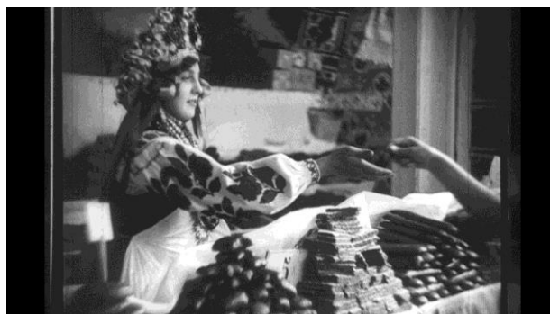
Рис. 8. Торговка сладостями на Нижегородской ярмарке. 1928 г. [28]

Кинокамера запечатлела неперенный атрибут популярнейшего развлечения ярмарок – карусель. На Нижегородской ярмарке увеселения располагались в большом Бразильском саду 1 : различные качели, аттракцион на проверку силы «Молот», зверинец и цирк, владельцы медведя и питона. В кадры попали и театральные афиши. Можно даже разобрать название одного из спектаклей – «Сильва». Рукописная табличка «Казино» позволяет предположить и его наличие среди увеселительных заведений Нижегородской ярмарки.