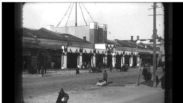
Рис. 10–11. Торговые павильоны. Вид центральной улицы 1-й Свердловской ярмарки, 1925 г. [33]

Люди смотрят, выбирают предлагаемый товар, другие уже идут с покупками, некоторые везут санки, полностью загруженные товарами. Извозчики мчатся по ярмарочным улицам на санях, спеша доставить пассажиров, другие стоят у главного здания.