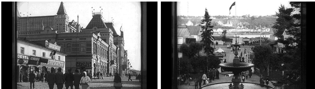
Рис 2–3. Вид центральной улицы Нижегородской ярмарки. Флачная площадь. 1928 г. [18]