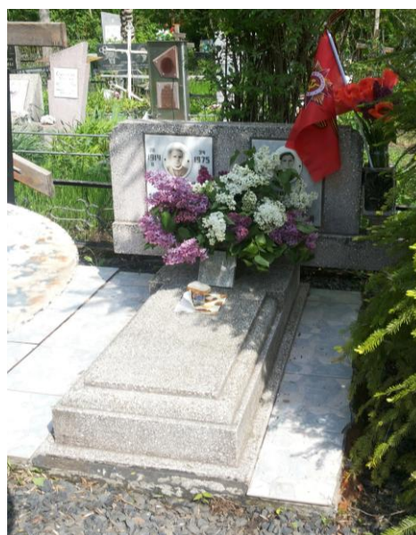
Рис. 1–2. Георгиевская ленточка и флаг в украшении могил на Северном кладбище города Ростова-на-Дону, 9 мая 2015 г., фото Н.А. Архипенко