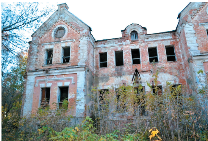
Рис. 3 – Современное состояние усадьбы баронов фон Мекк