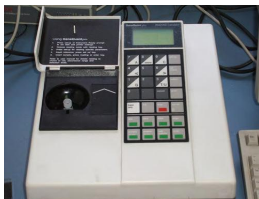
Слика 5: GENEQUANT pro RNA/DNA калкулатор

По изолација и оценување на квалитетот примерокот на ДНК се аликвотира во нормализирана концентрација. Подготовката на аликвоти служи за да се обезбедат подготвени ДНК примероци за дистрибуција како и да се спречи прекумерно замрзување и одмрзување на примарниот ДНК изолат што би резултирало со забележлива деградација на геномската ДНК. Сите примероци се чуваат замрзнати во Heraeus Sepatech замрзнувач на -80^{\circ}\text{C} . Вака подготвените и складирани ДНК примероци во банката се чуваат неопределено време [4].