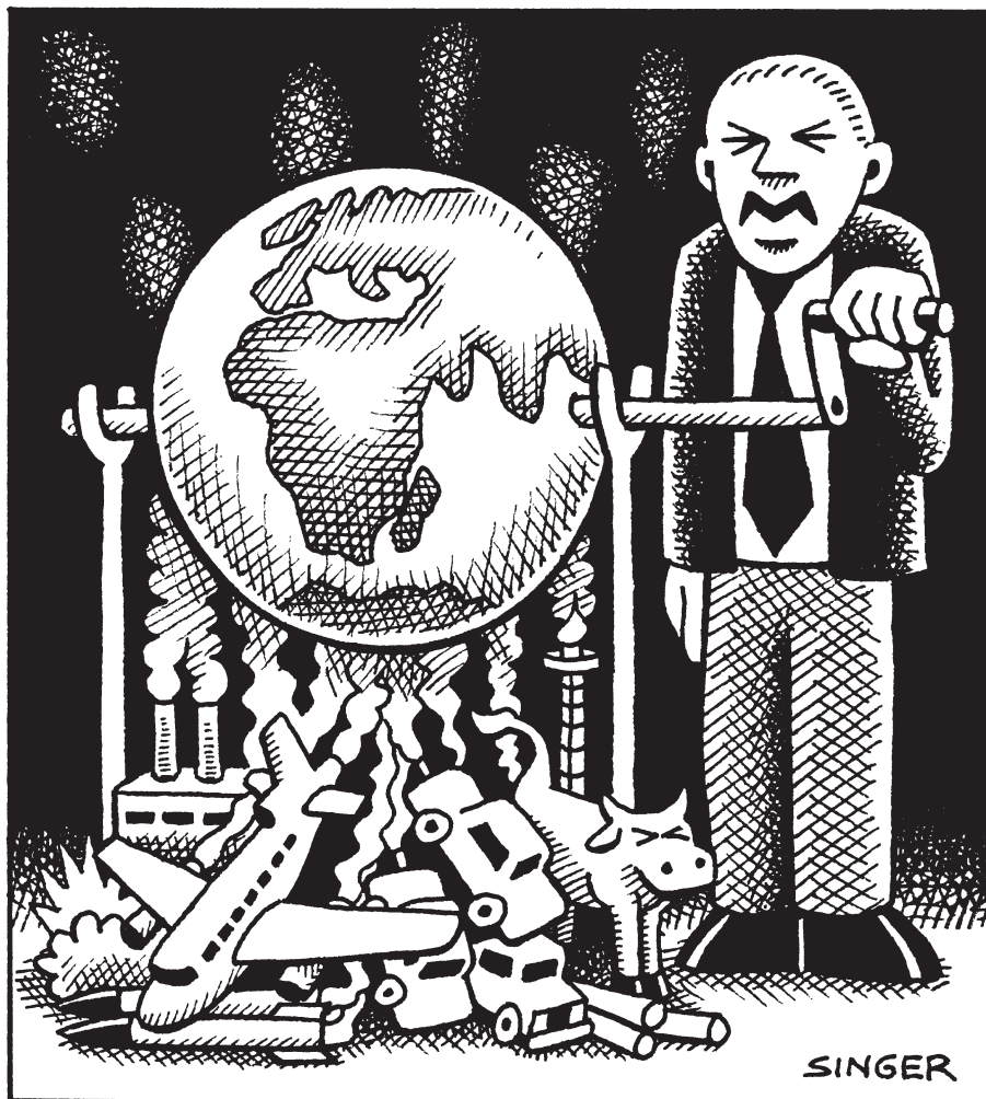
Figura 3. Viñeta No Exist Global Warming (Singer, 2009) 4 .

Grosso modo, el humor no persigue solamente la distracción o el placer del público. Detrás de su aparente sencillez evoca una reflexión, a veces amarga sobre la vida misma, lo cual deja en el espectador una inclinación hacia la toma de conciencia ante lo reflejado. Decía Jankelevitch (1983, p. 150), el humor es: “la sonrisa de la razón (...)”.