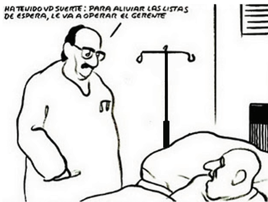
Figura 1: Viñeta de EL ROTO (2000) 2

El empleo del humor gráfico a través de viñetas en el tratamiento de temas educativos constituye una vía pedagógica alternativa que provoca la reflexión y promueve una mejor comprensión de los mismos, al tiempo que hace sonreír. Existe una predisposición positiva en el ser humano hacia la risa, hacia lo cómico, hacia el humor. Reírse de situaciones que reflejan la realidad cotidiana, ridiculizándola o exagerándola, es algo natural, propio de los individuos. La viñeta (figura 1) que se expone a continuación se centra en las largas listas de espera de los pacientes, quienes generalmente aguardan para ser operados en algunos hospitales y clínicas. La frase del médico: “ Ha tenido usted suerte, para aliviar las listas de espera, le va a operar el gerente ”, resume en primer lugar tensión por la evidencia de la cantidad de tiempo de espera por parte del paciente para ser operado, y segundo, más tensión por el hecho de que pueda operar el gerente, más preparado para otras tareas administrativas.