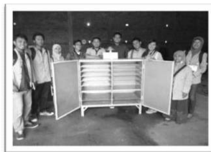
Gambar 2 Alat Pengering Tray Dryer Berbahan Bakar Biomassa