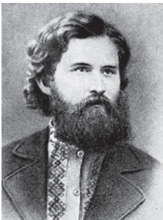
В. Г. Короленко (фото 1880 р.)

чином проаналізовані та інтерпретовані провідними політичними, громадськими, культурними діячами. Одним з таких діячів, які переважно більшість свого життя займалися трактуванням моральних цінностей, був видатний письменник-гуманіст, правозахисник та громадянський діяч Володимир Галактіонович Короленко, якого в російській критичній літературі кінця XIX – початку XX ст. нерідко називали апостолом «вселюдської любові», сентиментальним співаком жалісності і «загального примирення».