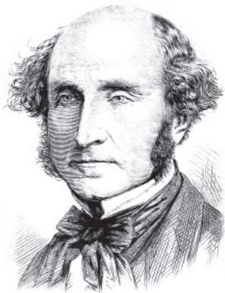
Портрет британського філософа і політичного діяча Джона Стюарта Мілля

Аналізуючи дану моральну систему, В. Короленко зазначає: «Під утилітаризмом я розумів дійсно утилітаризм Мілля і саме його положення: «найбільше щастя найбільшій кількості людей» – ось що має служити моральним стимулом людських прагнень. Теорію еґоїзму я теж вважаю загальнофілософською, або, якщо хочете, психологічною, взагалі абстрактним науковим додатком до утилітаризму, додатком, з яким я зовсім уже не згоден» [5]. Тобто, порівняно з «моральною системою» Ж.-М. Гюйо, який провідними вважав індивідуалістичні ціннісні орієнтації (прагнення досягнення найкращого результату діяльності лише для себе, що супроводжується повною байдужістю до результатів іншої людини (максимум для себе), В. Короленко значно кращим вважав утилітаризм Дж. С. Мілля, у вченні якого провідними були про соціальні ціннісні орієнтації (прагнення особистості