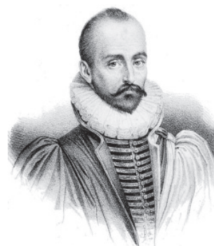
Портрет французького письменника і філософа епохи Відродження Мішеля де Монтеня

Визнаючи егоїзм головною причиною людських вчинків, М. Монтень не обурюється цим, вважаючи його цілком природним і навіть необхідним для людського щастя, адже коли людина буде приймати інтереси інших так само близько до серця, як свої власні, тоді в людини