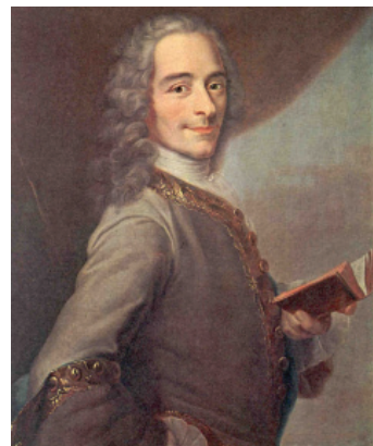
Портрет французького філософа-просвітника XVIII ст. Франсуа-Марі Аруе (Вольтера)

В. Дорошевич, зауважує: «тільки-но Вольтер дізнався, що нецтво й нетерпимість принесли людську жертву, він не міг працювати, зазначаючи, що не міг повернутися до роботи й знову став знаходити в житті радість тільки тоді, коли після героїчної боротьби з його боку нецтво й нетерпимість були осоромлені, а нещасний страчений Калас з фанатика, за що його судили, засудили й стратили, перетворився в того, ким він був насправді, – в жертву фанатизму і став символом релігійної нетерпимості. В. Короленка від Мултанської справи не змогла відірвати навіть звістка про важку хворобу його малолітньої дочки. Він забув також гаряче улюблену літературу, впродовж року не міг написати жодного рядка» [3, с.148].