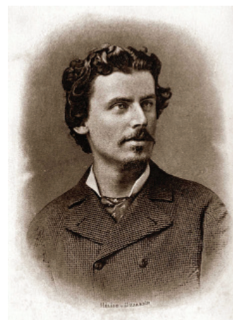
Портрет французького філософа Жана-Марі Гюйо

Ім'я Гюйо зустрічається в працях А. Коні, П. Кропоткіна, Д. Овсянко-Куликовського, В. Плеханова, Е. Радлова, В. Соловйова, І. Тхоржевського; ґрунтовна стаття С. Латишева про Ж.-М. Гюйо з'явилася в енциклопедії Брокгауза-Ефрона вже через п'ять років після смерті філософа. Усі основні праці Ж.-М. Гюйо в останні десятиліття XIX – на початку XX ст. перекладалися російською мовою. Подібний інтерес до творчості філософа в Росії, коли країна йшла до першої російської революції, багато в чому був зумовлений його критичним ставленням до релігії, догматизму і авторитаризму якої, на