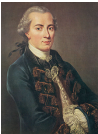
Портрет німецького філософа, засновника Німецької класичної філософії Іммануїла Канта

Вимога дотримання прав людей конкретизується Дж. С. Міллем у вченні про справедливість. Справедливість, вважає він, полягає в збереженні status quo (існуючого стану речей). Зі справедливістю, як однією з головних про соціальних ціннісних орієнтацій, пов'язані вимоги – подяки: на добро усім відповідай добром; відплати (або покарання): всім віддавай