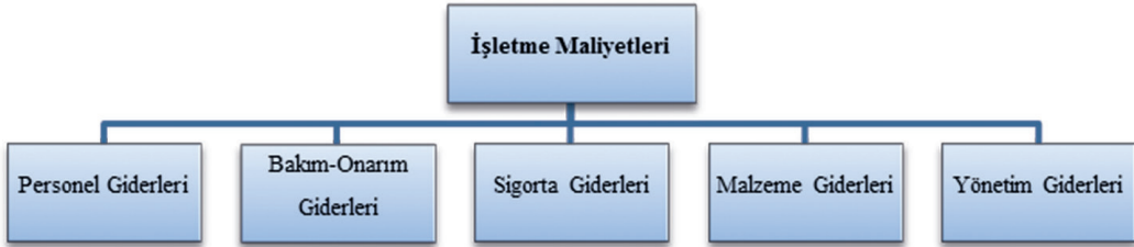
Şekil 2. Gemi İşletme Maliyetleri (Running Costs) [13, 19]

Taşıma maliyetleri de işletme, sefer ve sermaye maliyetleri olmak üzere üç başlık altında ele alınabilir. Burada sefer maliyetleri, geminin seferine bağlı olarak yük taşınması için yapması gerekli giderlerden oluşur. Bu maliyetler; sefer boyunca harcanan yakıt giderleri, her türlü kanal ve boğaz geçiş ücretleri, liman ücretleri, acente hizmet ve ücretleri, kılavuzluk ve römorkör hizmetleri olarak sıralanabilir [17]. Sermaye maliyeti,