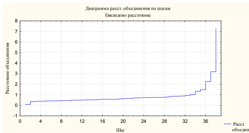
Рис. 2. Графік схеми об'єднання по крокам

Економіко-математичне моделювання виконаємо на базі отриманої матриці стандартизованих значень ознак за допомогою програми Statistica. На першому етапі було використано ієрархічну агломеративну процедуру класифікації Joining (Tree clustering) – дерево кластеризації за алгорит-