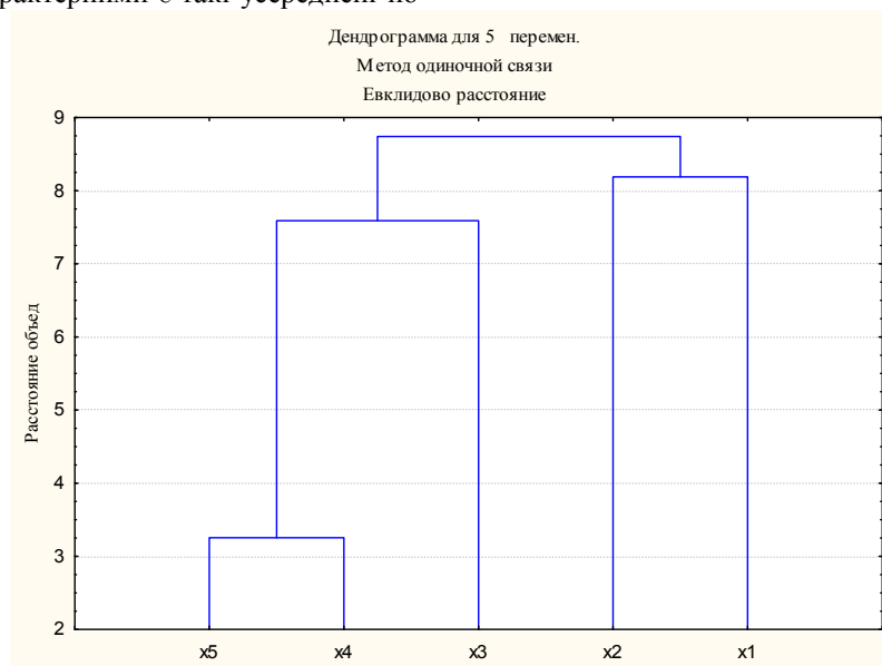
Рис. 4. Групування ознак за ієрархічною процедурою

казники: середня завантаженість одного місця становить 37,0 одиниць, середня вартість ліжка-дня (людино-дня) – 410,5 грн., доходна ставка на одного клієнта – 4156,46 грн., трудомісткість наданих послуг – 1,33 коп., матеріаломісткість наданих послуг – 0,75 коп.