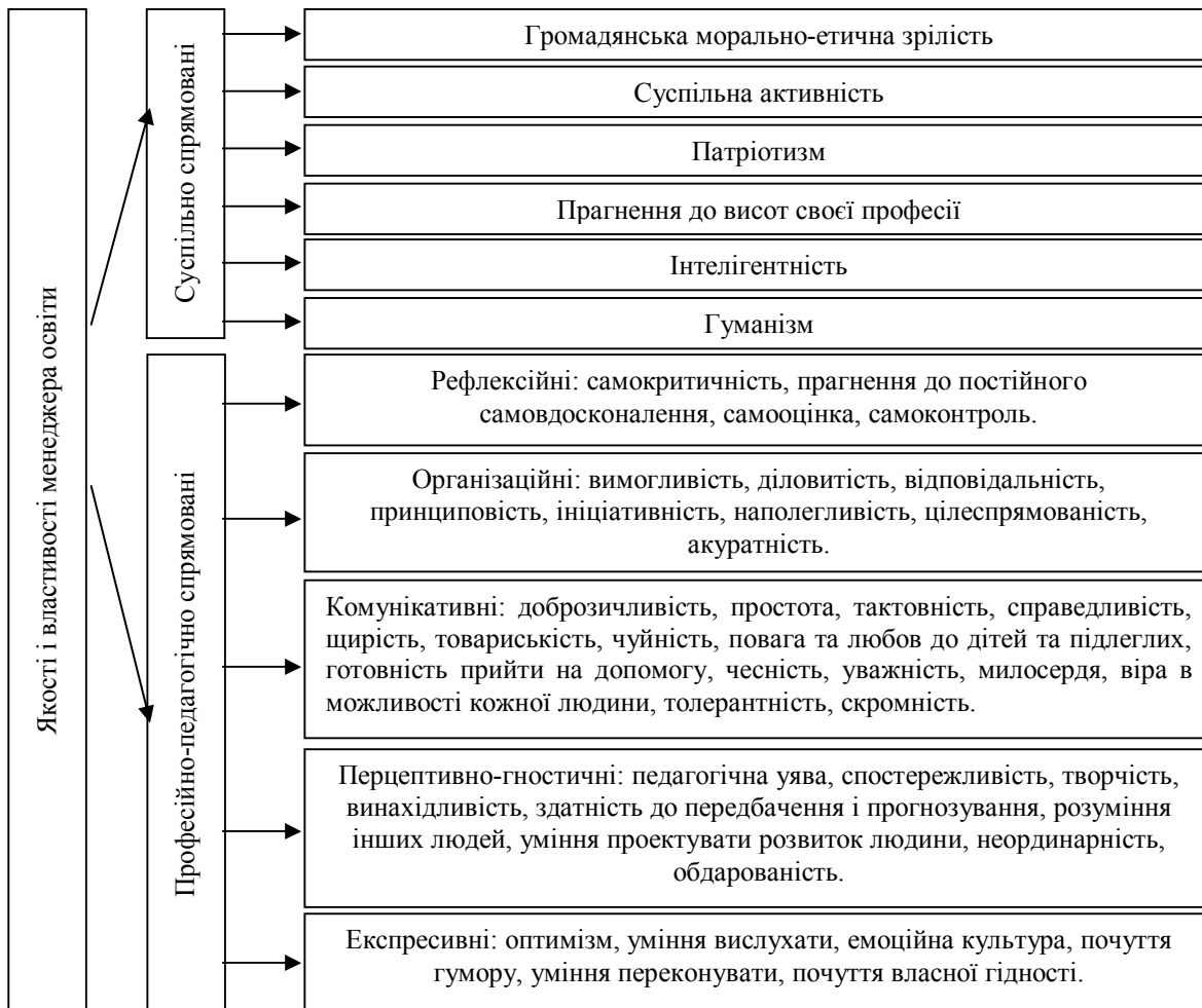
Рис.2. Основні якості і властивості менеджера освіти