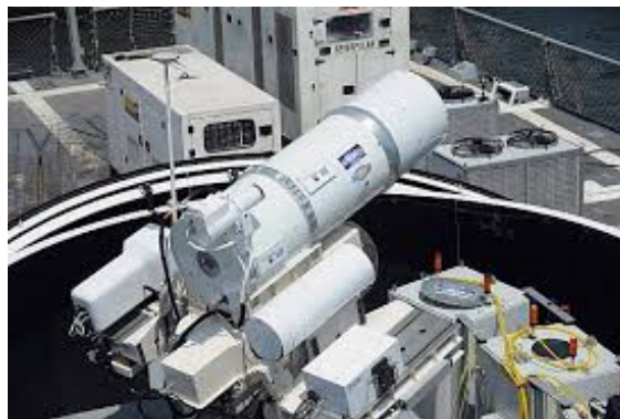
Program američke ratne mornarice LaWS upotrebljava jeftinu tehnologiju fiberoptičkih lasera kao osnov za lasersko oružje koje bi bilo integrisano na postojeću platformu Phalanx

Američka ratna mornarica po prvi put je na korak od uvođenja visokoenergetskog laserskog oružja u operativnu upotrebu, a nedavno je objavila planove za testiranje prototipa elektromagnetskog šinskog topa na plovilu.