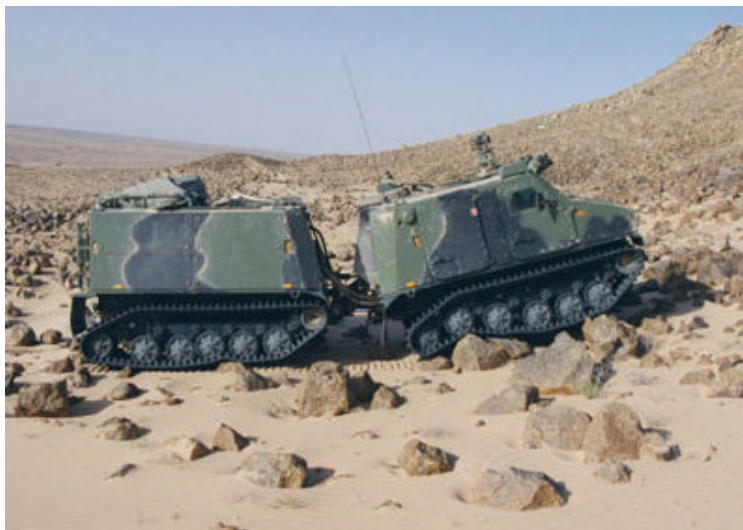
Švedsko vozilo BvS 10 MkIIIB sa gumenim gusenicama

Vozila su, takođe, opremljena oružnim sistemom Protector , opremljenim mitraljezom M2 HB kalibra .50 koji predstavlja standard na većini švedskih OBV.