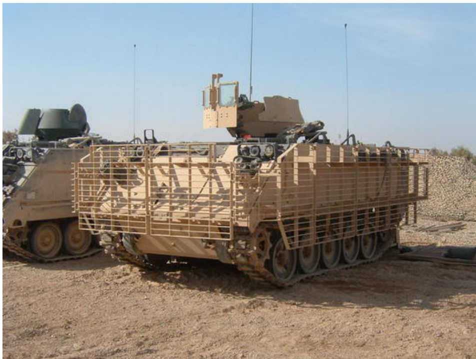
Danski M 113 sa rešetkastim oklopom

Razmatrane su dve varijante točkaša: 8X8 Piranha 5 , kompanije General Dynamics European Land Systems MOWAG i VBCL (Vehicule Blinde de Combat d'infanterie – oklopno vozilo pešadije) kompanije Nexter Systems . Tri verzije guseničara bile su ASKOD 2 , kompanije General Dynamics European Land Systems , Santa Barbara Sistemas , Armadillo , kompanije BAE Systems Hagglunds i Protected Mission Modular Carrier G 5 (zaštićeni modularni transporter) kompanije FFG Flensburger .