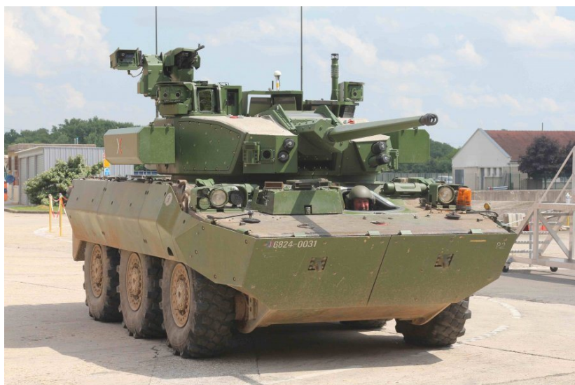
AMX-10RC 6X6 oklopno vozilo opremljeno kupolom T40M sa oružnom stanicom CTWS CTAI 40 mm i daljinski upravljanim mitraljezom 7.62 mm montiranim na krovu vozila

Tokom decembra 2013. godine podnet je zahtev za informacije u vezi EBRC i VBMR i očekuje se njegovo ispunjavanje ponudom kompanija Nexter Systems , Renault Trucks Defense (koja sada poseduje Panhard Defense ) i Thales . EBRC je planiran kao zamena za oklopno vozilo AMX-10CR 6X6 i za oklopno vozilo Panhard defense Sagaie 6X6 sa topom 90 mm.