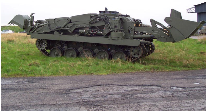
Terrier – borbeno inženjersko vozilo

Nakon raspisanog konkursa za zamenu Land Rover vozila, Velika Britanija odabrala je vozilo Ocelot kompanije General Dynamics Land Systems (GDLS) , koje je odmah preimenovano u Foxhound . Za sada su ugovori potpisani za 400 jedinica.