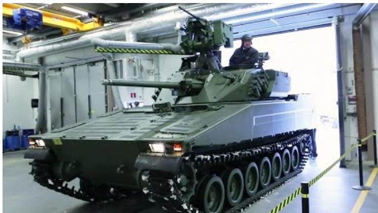
Prvi norveški CV9030N sa oružnom stanicom Kongsberg Protector RWS montiranom na kupoli i naoružanom mitraljezom kalibra .50

Nemačka vojska u svom sastavu ima i veliki broj zaštićenih vozila Dingo ( All-Protected Vehicle – APV ) i lako- oklopljenih vazdušnodesantnih vozila Mungo . Proizvedeno je preko 1.000 vozila Dingo .