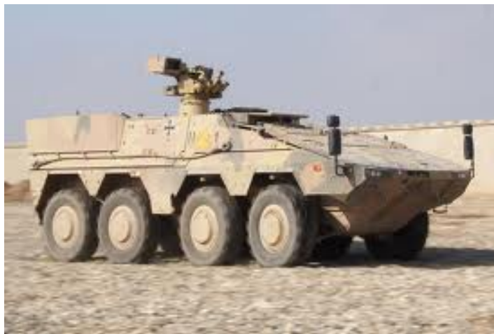
Najnovije vozilo nemačke vojske Boxer MRV u konfiguraciji A1 , u upotrebi u Avganistanu sa oružnom stanicom FLW 2000 i mitraljezom M2 HB kalibra .50

BVP Marder I , kompanije Rheinmetall , proizveden je još 1971. godine, a od tada je konstantno modernizovan, iako su i dalje ostali isti top 20 mm i 7.62 mm. BVP Marder I biće zamenjen sa BVP Puma iako je isporuka tog vozila pretrpela određena kašnjenja s obzirom na to da je prvi prototip izašao još 2005. godine. Nemačka vojska očekivala je isporuku 405 BVP Puma radi zamene svojih vozila Marder I , ali je do sada isporučeno samo 350 jedinica. Poslednje isporuke očekuju se 2020. godine.