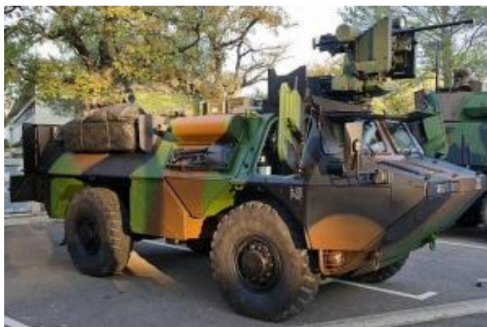
Modernizovani francuski VAB 4X4 opremljen applique pasivnim oklopom i oružnom stanicom Kongsberg Protector sa mitraljezom M2 HB kalibra .50

Francuska vojska u svom sastavu ima i veliki broj izviđačkih vozila Vehicule Blinde Leger – lako oklopno vozilo (VBL) koje je proizvela kompanija Panhard Defense . Poslednje od ukupno 1.621 ovog vozila isporučeno 2011. godine. VBL je izvezen u najmanje 15 zemalja, a najteža varijanta vozila sa oznakom Mk 2, opremljena oružnom stanicom Kongsberg Protector , prodata je Kuvajtu.