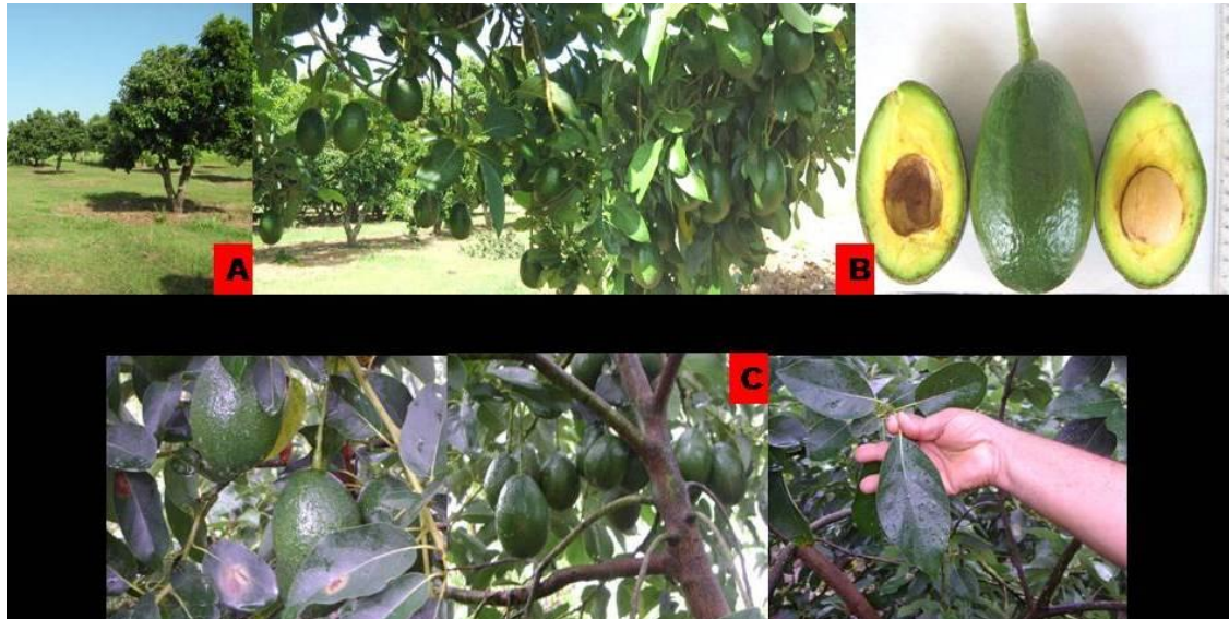
Fig. 2. A y B) Árboles en producción y frutos en la UCTB Alquizar. C) Frutos, ramas y hojas en plantación de Pinar del Río.