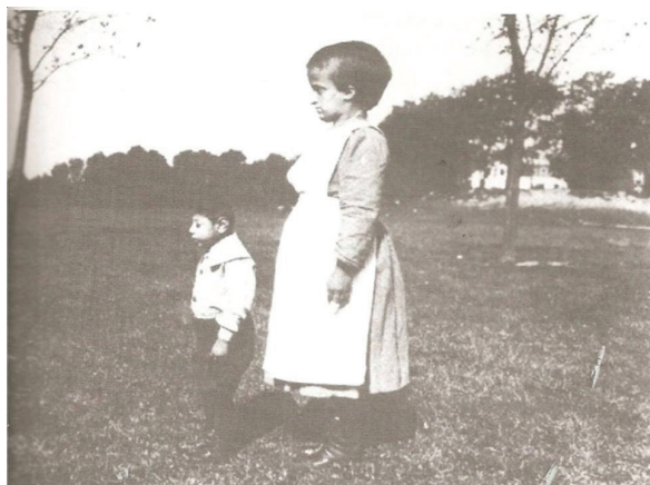
Lewis H. Hine. New Jersey, 1924.

Em A Câmara Clara , Roland Barthes apresenta sua leitura acerca dos punctums de algumas fotografias, acompanhada de breves enunciados. Sobre a fotografia acima, escreve o autor: “desprezo todo saber, toda cultura... Vejo apenas a imensa gola Danton do garoto, o curativo no dedo da menina...” (Barthes, 1984, p. 79).