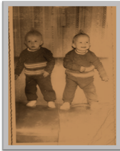
«As irmãs gêmeas surdas no sofá»

«Uma sorri, a outra observa. Cada uma olha para um lado. Dupla, oposta, igual, diferente. A da direita e a da esquerda, as duas de fralda, o cacho no alto da cabeça se repete na tentativa de tornar igual. A linha tênue do sofá separa uma da outra». As vidas quase imperceptíveis, que escapam das vidas docentes, ganham novos contornos nas narrativas visuais, “o punctum é o que é acrescentado à foto e que todavia já está lá” (BARTHES, 1984, p. 85).