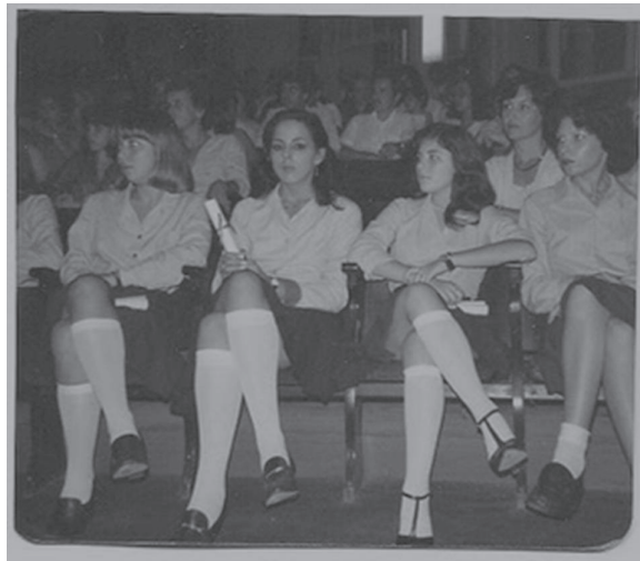
«Percebeu menina formando 2º Grau na Escola, menina roupa antiga»

O caminhar na educação nos traz marcas, quebram os nossos paradigmas, mudam as nossas concepções, o que achamos que é, não é mais. Tudo sempre em constante estado de mutação, turbilhões de ideias perpassam as nossas cabeças, e às vezes podemos olhar para duas meninas e vê-las como iguais e perceber que a única coisa que as diferem é um objeto que carregam no pescoço: a merendeira. Será mesmo? (Janaina dos Santos – enunciado sobre a fotografia de Paula Weiss).