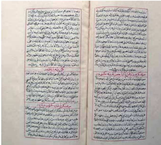
Ek.6. Abdurrahman Abdi Paşa'ya mektuplar (Münşeat Mecmuası, T.S.M.K., Bağdat nr. 174, vr.38A-40B).