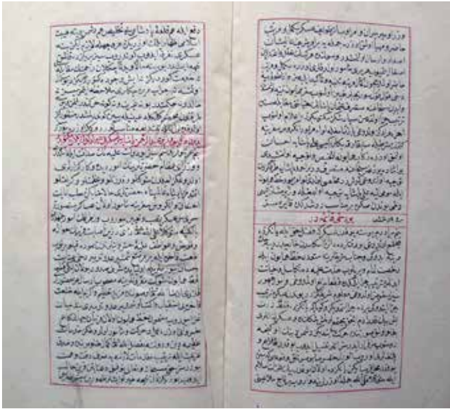
Ek.3. Abdurrahman Abdi Paşa'ya mektuplar (Münşeat Mecmuası, T.S.M.K., Bağdat nr. 174, vr.38A-40B).