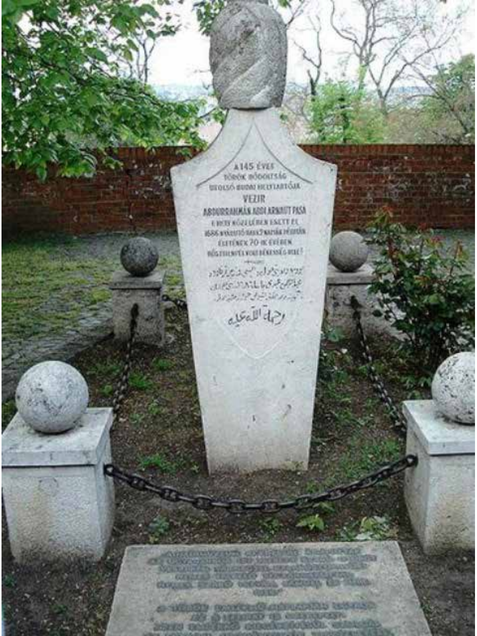
Ek.2. Abdurrahman Abdi Paşa'nın Budin kalesindeki mezarı.