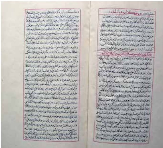
Ek.4. Abdurrahman Abdi Paşa'ya mektuplar (Münşeat Mecmuası, T.S.M.K., Bağdat nr. 174, vr.38A-40B).