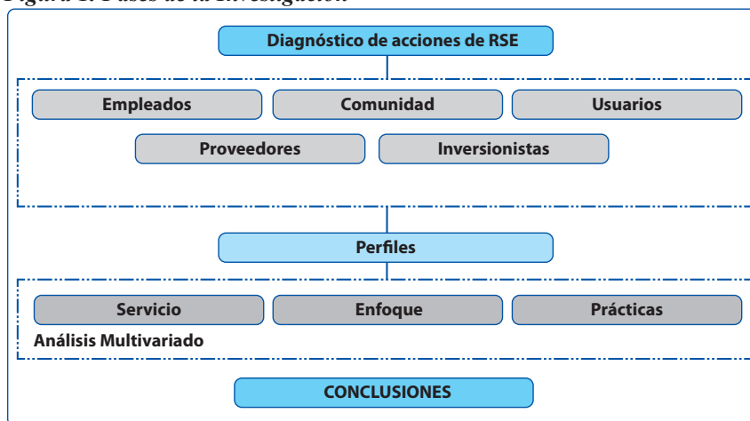
Figura 1. Fases de la Investigación

Posterior a ello se realizó un análisis cuantitativo para determinar la correspondencia entre las diferentes empresas determinado si existían tendencias que permitieran definir perfiles de RSE para estas entidades, este proceso se realizó a través de los resultados que arrojó la encuesta por medio de una técnica de análisis multivariable elaborado con el programa Numerical Taxonomy System (NTSYS) (6).