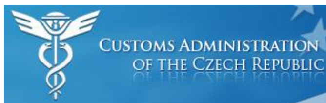
Рис. 1. Эмблема Таможенной службы Чешской Республики

Полномочия чешской таможенной службы чрезвычайно широки и разнообразны. Они включают в себя как фискальную, так и нефискальную составляющие. В числе нефискальных полномочий ТС Чехии отдельно можно выделить юрисдикционную компетенцию.