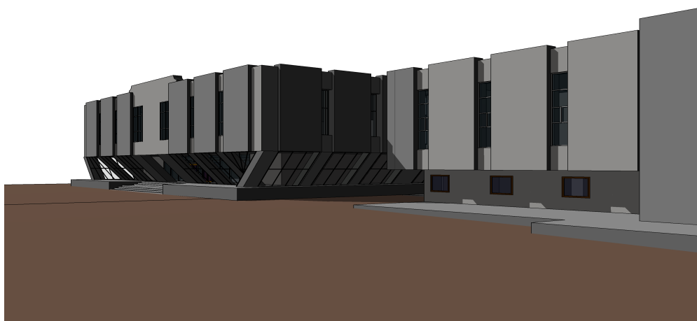
Р и с. 1. Перспектива здания – учебный проект реконструкции Музейного комплекса С. Эрзи, выполненный при помощи программного комплекса Revit Architecture

Еще одним преимуществом BIM-технологии является ее способность задействовать в работе над проектом нескольких человек, занятых разными разделами проектирования. Например, при расчете зданий и сооружений современными программными комплексами, основанными на методе конечных элементов, нередко используются модели, созданные в таких BIM-системах как ArchiCAD, Revit Architecture и др. Все это также существенно упрощает весь цикл моделирования и расчетов. Аналогичный подход незаменим для организации взаимосвязи конструктивной части с дальнейшей работой по проектированию внутреннего оборудования, в том числе при создании сложнейших по форме объектов. Дальнейшее усложнение конструктивных и архитектурных особенностей будет только способствовать развитию и внедрению BIM [3].