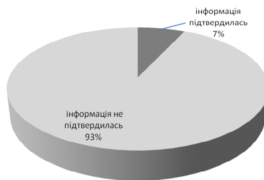
Рис. 4. Стан підтвердження інформації, наведеної у скаргах громадян, посадових осіб підприємств, установ, організацій на дії працівників КРУ в Харківській області у першому півріччі 2011 року

Приведені на рис. 4 дані вказують на те, що відсоток підтвердження фактів порушень дуже малий. Аналогічна ситуація за попередні роки. У 2008 році підтверджено 13% скарг, у 2009 році – 10%, у 2010 – 3%. Тобто не досить раціонально використовуються трудові ресурси. На думку авторів, більш раціонально було б відмовитись від даного виду прийому скарг, а приймати їх лише через «телефон довіри».