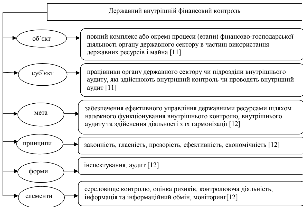
Рис. 1. Основні компоненти змісту ДВФК

На рис. 1 представлені основні компоненти, які визначають змістовне підґрунтя внутрішнього фінансового контролю на державному рівні.