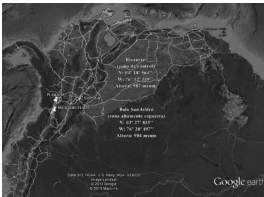
Figura 1. Ubicación de los puntos de muestreo