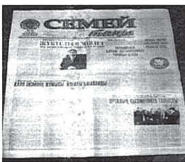
Рис.12. Газета «Семей таны», 16 марта 2012 год, № 22

С 1 января 1922 года гостипографии фактически перешли на самокооперативность и все печатные работы стали исполняться только за наличный расчет.