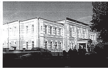
Рис.2. г. Семипалатинск, 1894 г., Здание гимназии. Ее директора и учителя принимали активное участие в работе первых печатных изданий. Ныне здесь размещается один из частных вузов

Участник конференции, Национального первенства по научной аналитике, Открытого Европейско-Азиатского первенства по научной аналитике