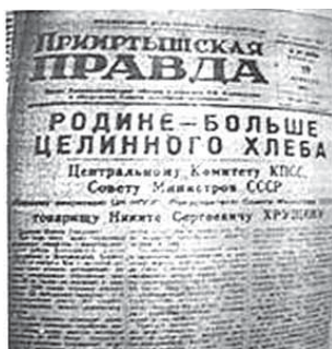
Рис.10. «Прииртышская правда», 1963 г., 19 февраля. Актуальность текущих задач – предмет основной информации. Это касалось и в освещении целинной эпопеи

С 1 января 1921 года прием заказов на типографские работы начал производиться, в силу новой экономической политики, по свободному соглашению с заказчиками. То есть часть стоимости заказа выплачивалась продуктами или предметами в натурфонд рабочих предприятий [4, с.51].