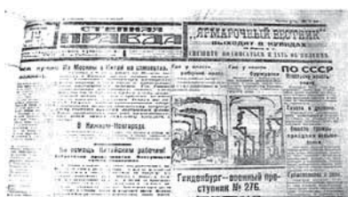
Рис.7. Газета «Степная правда», 1925 г., № 130 (из фондов Краеведческого музея)