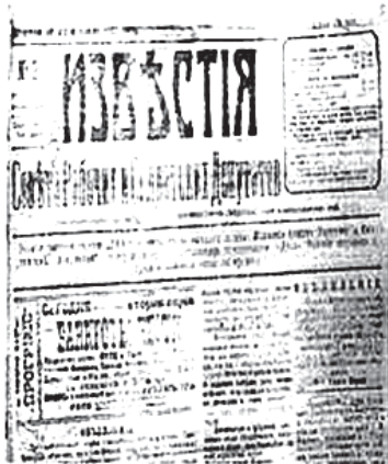
Рис.5. Газета «Известия Советов рабочих и солдатских депутатов», 1918, № 2