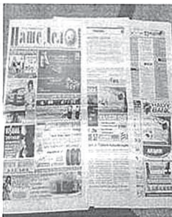
Рис.13. Газета «Наше дело», 23 февраля 2012 год, № 7 (835) (фото авторов)