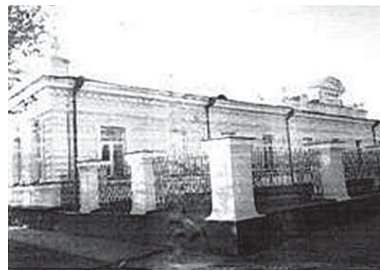
Рис.1. г. Семипалатинск. Дом губернатора одноименной области, образованной в 1854 г. Здесь приняты решения об учреждении первых газет. Ныне здесь размещается Историко-Краеведческий музей

С начала второй половины XIX в., после образования одноименной области, кроме купцов, в Семипалатинске заметную роль стали играть владельцы промышленных производств. Поначалу это были совсем незначительные предприятия. Как свидетельствовал А. Янушкевич, посетивший город в это время, «Промышленность города