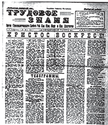
Рис.6. Газета «Трудовое знание», 1918, №1