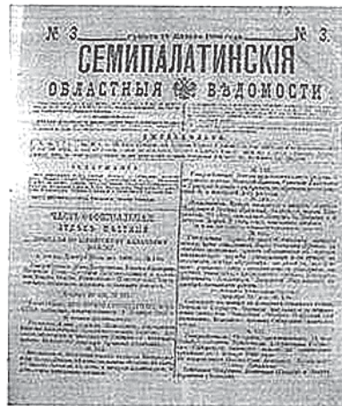
Рис.4. Газета «Семипалатинские областные ведомости», 1886г., №3