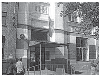
Рис.11. Специализированное здание для типографий. Построено еще в 1916 г. До распада СССР это здание работало по назначению