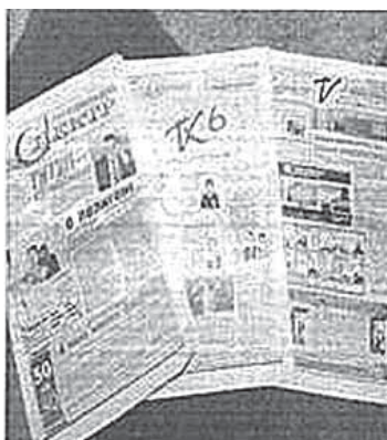
Рис.14. Газета «Спектр», 15 февраля 2012 год, № 7 (787)

Тяжелое материальное положение привело к тому, что к концу 1925 года «Степная правда» стала выходить не регулярно, а 14 февраля 1926 года – вышел ее последний номер.