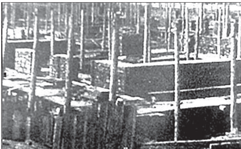
Рис.8. Фундамент нового завода – первенца кожевенной промышленности Казахстана. 1926 г.