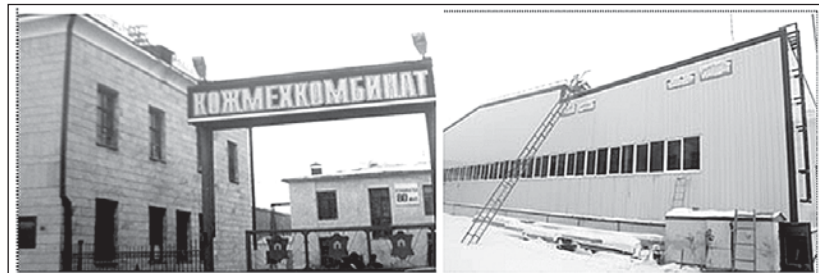
Рис.18-19. От архитектурного интерьера 30-х годов XX в. к современным апартаментам кожевенно-мехового производства

Реконструкция кожевенного производства осуществляется комбинатом совместно с АО «Банк Развития Казахстана». Ввод в эксплуатацию нового кожевенного завода, оснащенного современным итальянским оборудованием последнего поколения, позволит значительно сократить