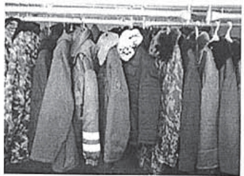
Рис.10-17. Основные цеха ТОО «Семипалатинский кожевенно-меховой комбинат»

скасть и более качественные, и новые виды продукции. Реконструкция и модернизация комбината состоит из 3-х этапов: первый этап , реконструкция и модернизация кожевенного производства; второй этап , реконструкция и модернизация овчинно-шубного и швейного производств; третий этап , реконструкция и модернизация