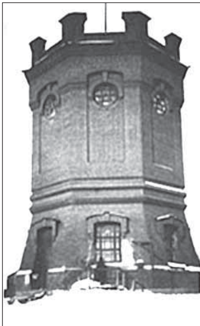
Рис.7. Здание насосной станции – первого водопровода г.Семипалатинска. 1910 г., построенного с участием Плещеева П.Ф.

раслей является кожевенное производство, которое берет начало с конца XIX века, когда купец П.Ф. Плещеев в небольшом полуподвальном помещении организовал кустарное производство кожи. Именно с него стали расти народные умельцы, в совершенстве владевшие традициями кожевенного ремесла, получившего широкое распространение на территории Казахстана. Из рук мастеров, от-