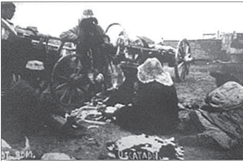
Рис.3. Ярмарка на территории Семипалатинска. Вторая половина XIX в.

Значительный рост товарооборота мотивировал развитие капиталистических форм кредитования. В 1887 г. был открыт Городской банк. Активы банка с 19,9 млн. руб. в 1893 г. выросли до 35 млн. руб. в 1905 г. [4, с.46]. Еще более оживилась экономическая жизнь края после открытия Сибирской железной дороги. Согласно имеющимся отчетам за 1888 г., по Семи-