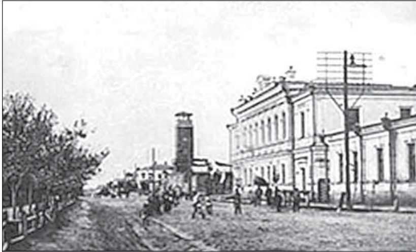
Рис.2. Семипалатинск в начале XX в.

Улица Кольванская (ныне Интернациональная). Сквер Никольского собора (ныне Центральный парк), деревянная каланча (сегодня на этом месте – каменная) и здание Городского банка (ныне здесь размещается финансово-экономический колледж)