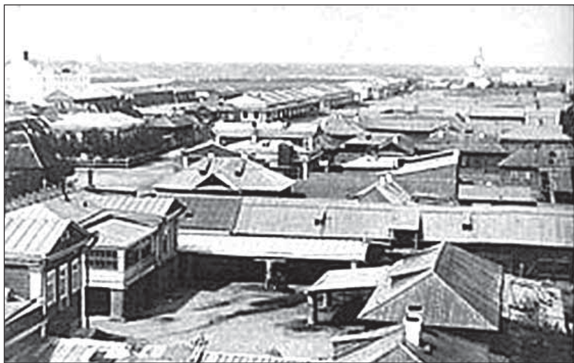
Рис.1. Семипалатинск во второй половине XIX в. Вид с восточной стороны (из фонда Краеведческого музея)

В 1854 г. в Семипалатинске проживало 18864 человека [2, с.45]. Значительное влияние на развитие