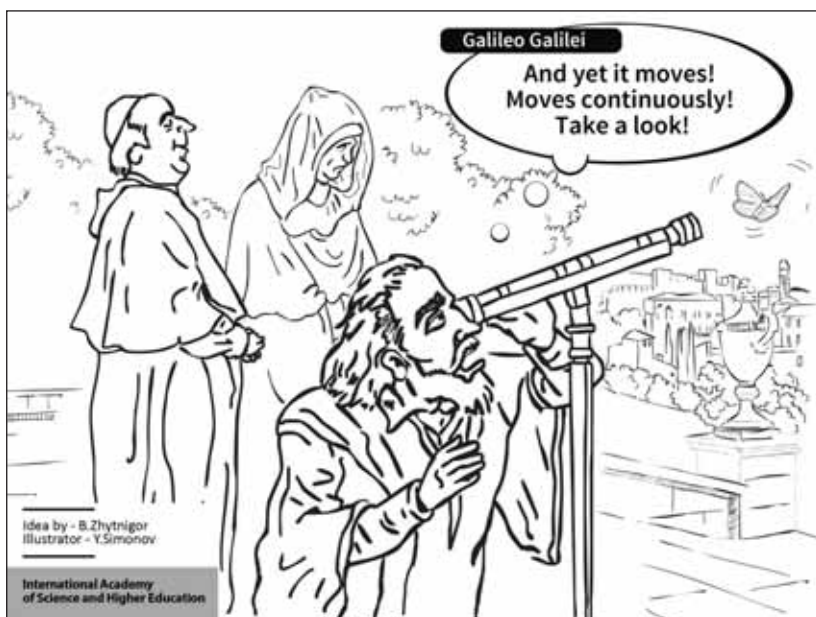
Idea by - B.Zhytnigor Illustrator - Y.Simonov International Academy of Science and Higher Education