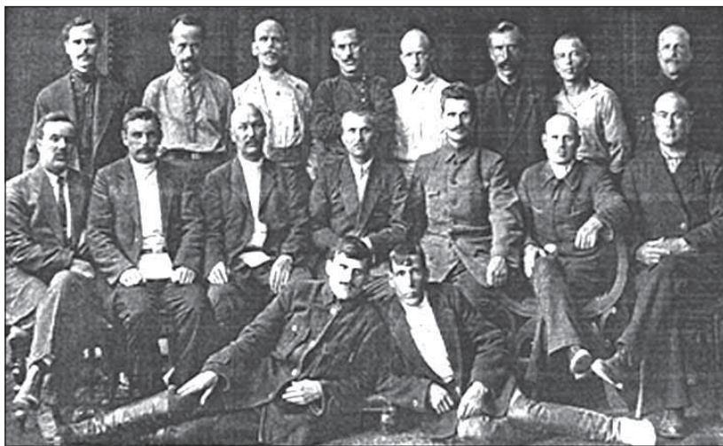
Рис.9. Элита мастеров кожевенно-меховых производств Семипалатинска. Руководители заводов и начальники цехов. 1926 г. (из фондов Краеведческого музея)

войны под девизом «все - для фронта, все - для победы» комбинат производил яловые сапоги, ботинки, поясные офицерские ремни, жилеты из шубного лоскута, фартуки и рукавицы из спилка, полушубки, бекеши, тулупы, рукавицы.