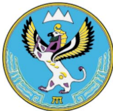
Рис. 3. Герб Республики Алтай

Изображения лосей наряду с птицами часто встречаются в памятниках пермского звериного стиля. Лик женщины, являясь новой ступенью в развитии искусства вычегдских коми, связан с более поздним этапом формирования этого народа, хронологические рамки которого заканчиваются XIV веком. Вместе с тем птица – олицетворение государственности и власти, призванной охранять Родину и народ, способствовать их развитию и процветанию. Поэтому птица изображена на взлете. Распахнутость крыльев означает также гостеприимство, приглашение к сотрудничеству. В целом центральная золотая фигура выступает символом доброй воли и энергии народа. Лик женщины символизирует жизнедающую солнечную богиню, мать мира, хранительницу всего святого и доброго. Лось – символ силы, благородства, красоты, а в космологических представлениях – синтез гармоничного строения мира – органично вписался в рисунок перьев, его изображение придает позе птицы устойчивость, равновесие. Сочетание золотого и красного в фольклоре народа коми является символом утреннего, весеннего, теплого солнца, материнства» [16].