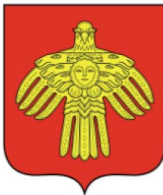
Рис. 2 . Герб Республики Коми

Всадник со знаменем с ленских скал и солнце, изображенные на гербе, печатях, официальных бланках Якутии, обрели новую жизнь, двинулись по всей России и далеко за ее пределы» [15].