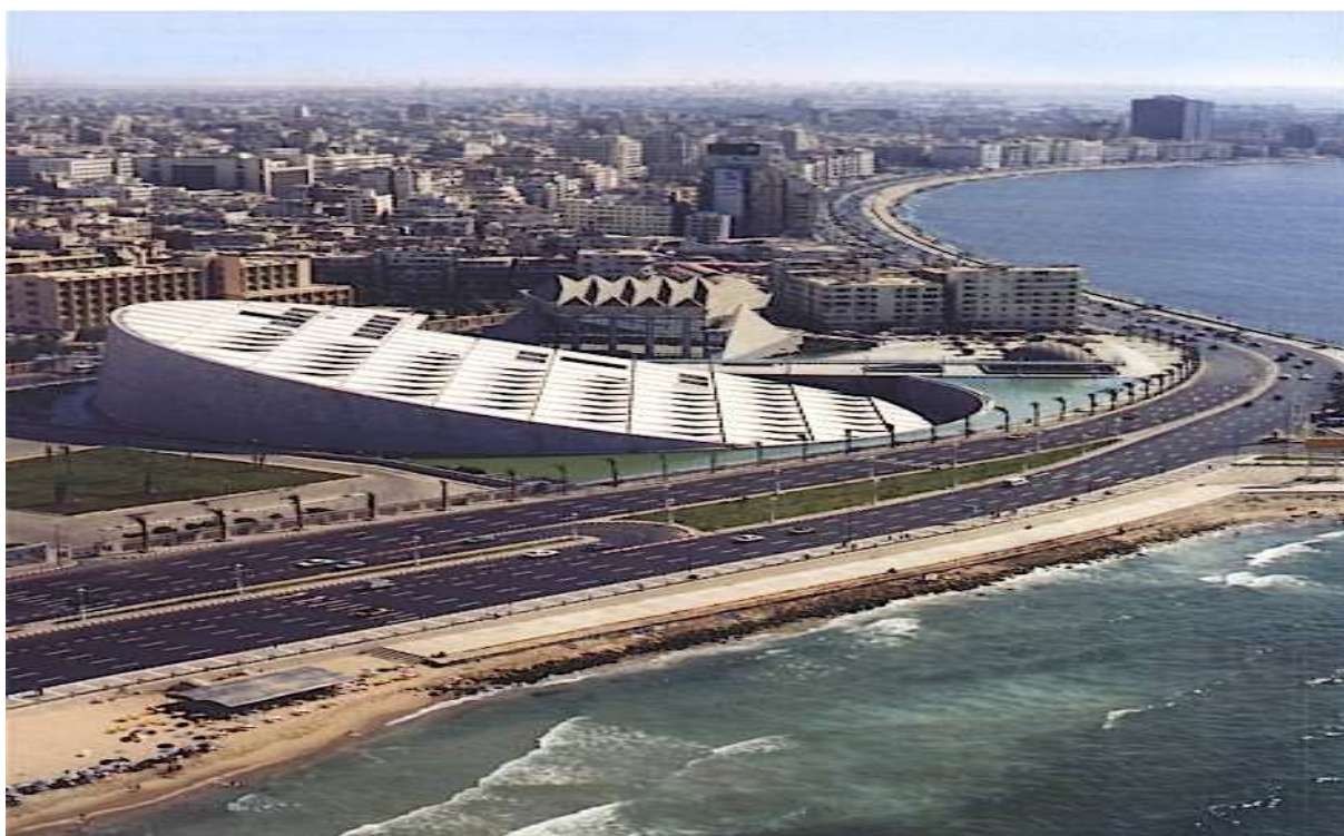
Древний храм в Абу-Сембеле, Египет