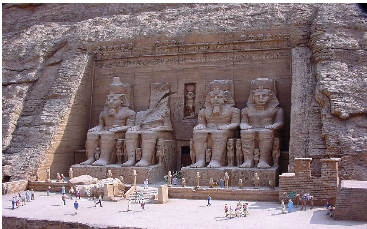
Панорама г. Александрия, Александрийская библиотека, Египет